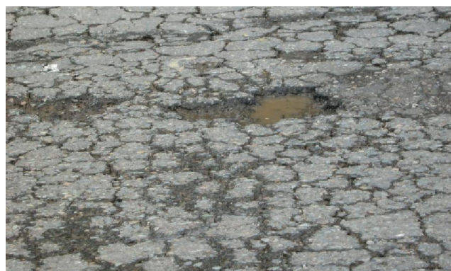
Figura N°2. Estructura de pavimento flexible deteriorada por efectos dinámicos bajo presencia de agua de infiltración. 3

Estas apariciones de fallos traen deterioros tanto en la estructura como en la superficie, la cual es muy evidente, como se puede observar en la Figura N° 2.