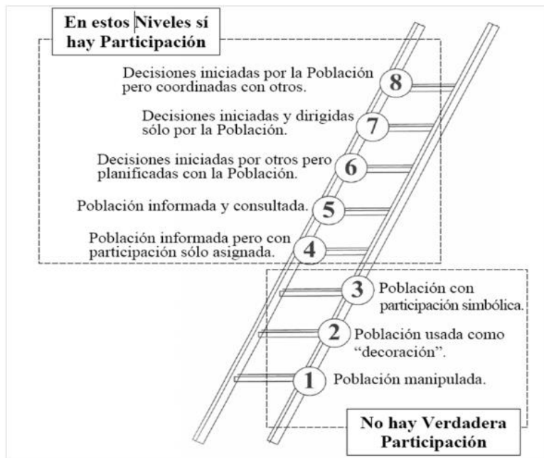
I Ilustración 1 Grados de participación ciudadana. Tomado de "La escalera de la participación" por Arnstein, 1969, pág. 3. Recuperado de http://www.upla.cl/noticias/wp-content/uploads/2014/08/2014_0805_faceduc_orientacion_escalera_participacion.pdf

Con base en lo anterior, es posible evidenciar que en los tres primeros niveles (Población manipulada, Población usada como "Decoración" y Población con participación simbólica) no existen mecanismos que permitan que los ciudadanos se vinculen de forma directa en la planeación de estrategias de alcance colectivo, esto quiere decir que los mecanismos del estado o los actores que cuentan con el poder, direccionan las acciones y deciden el rumbo de las mismas, atribuyendo un sentido de seguimiento de instrucciones, como única alternativa para garantizar el bien común.