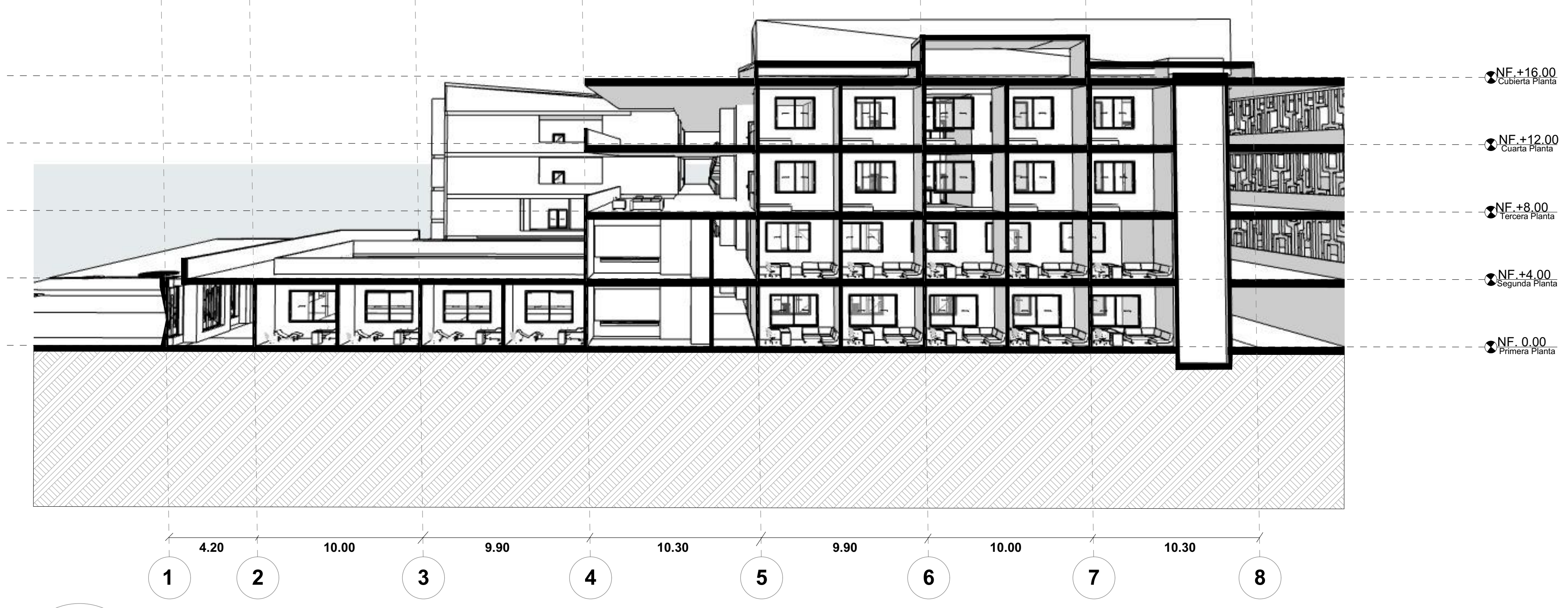
S-02 Seccion Fugada Rehabilitacion Esc 1:200