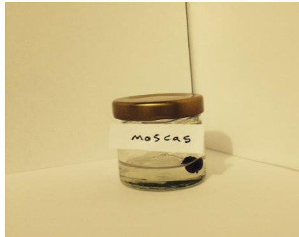
Evidencia numero 9.