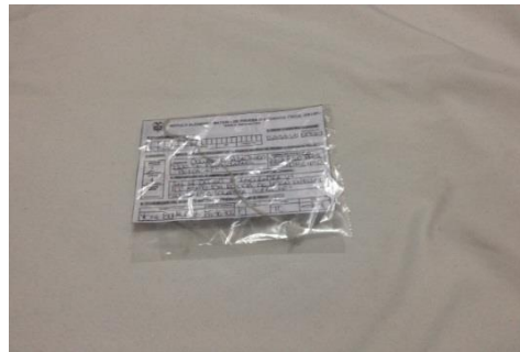
Evidencia número 3.