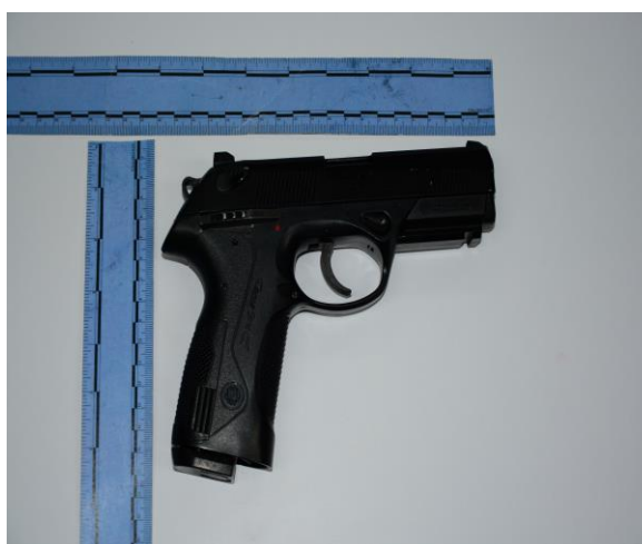
IMAGEN NUMERO 13

IMAGEN NO 13: PRIMER PLANO: SE OBSERVA EMP 6 VAINILLA METALICA LA CUAL SE RECOLECTA Y SE EMBALA.