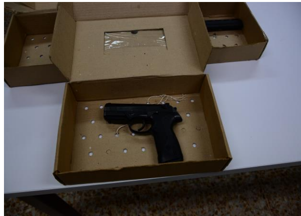
IMAGEN NUMERO 22

IMAGEN NUMERO 23. EVIDENCIA NUMERO 7 SE OBSERVA EMBALADA Y ROTULADA.