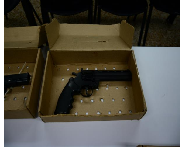
IMAGEN NUMERO 20

IMAGEN NUMERO 20. EVIDENCIA 5 SE OBSERVA EMBALADA Y ROTULADA.