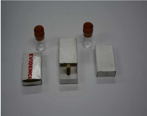
IMAGEN NUMERO 19

IMAGEN NUMERO 19. EVIDENCIA 1 , 3 y 6 SE OBSERVA EMBALADO Y ROTULADO