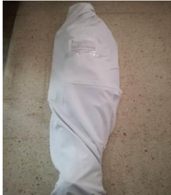
IMAGEN NUMERO 17