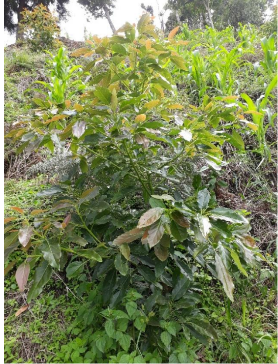
(Finca El Rodeo, Octubre 2017)