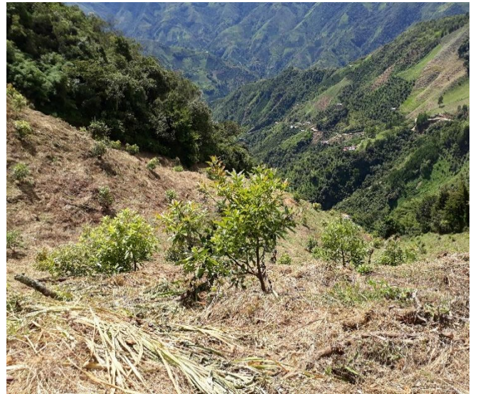
(Finca El Rodeo, Julio 2018)