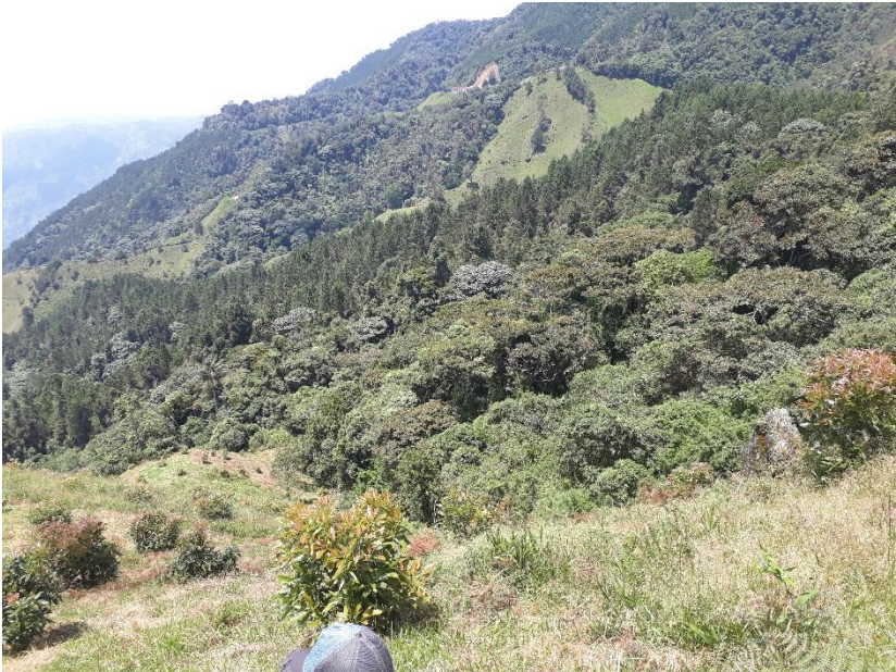
(Finca El Rodeo, Mayo 2019)