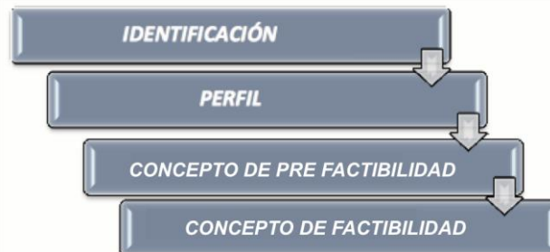
Ilustración 2: Fases de la Etapa de Pre Factibilidad

logísticos que se requieren para su ejecución, buscando especificar la planificación y el montaje del proyecto; en donde se incluyen necesidades como las de insumos, estimados de costos, identificación de posibles obstáculos, etc. (Guerrero & Castillo, 2011). Así, la etapa de Pre Factibilidad se compone de cuatro fases, a partir de las cuales se dividen y delimitan los pasos sucesivos de preparación y evaluación.