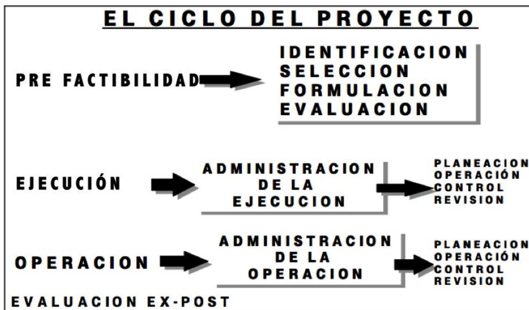
Ilustración 1: Ciclo del Proyecto