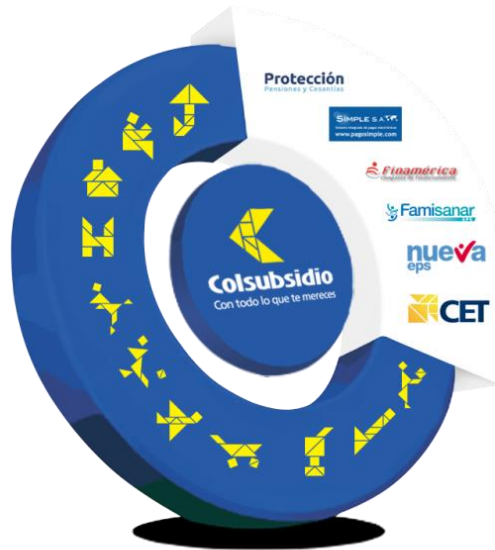
Ilustración 4: Prestación de Servicios Colsubsidio

desarrollo y responsabilidad social aportados por los entes territoriales y empresas nacionales e internacionales.