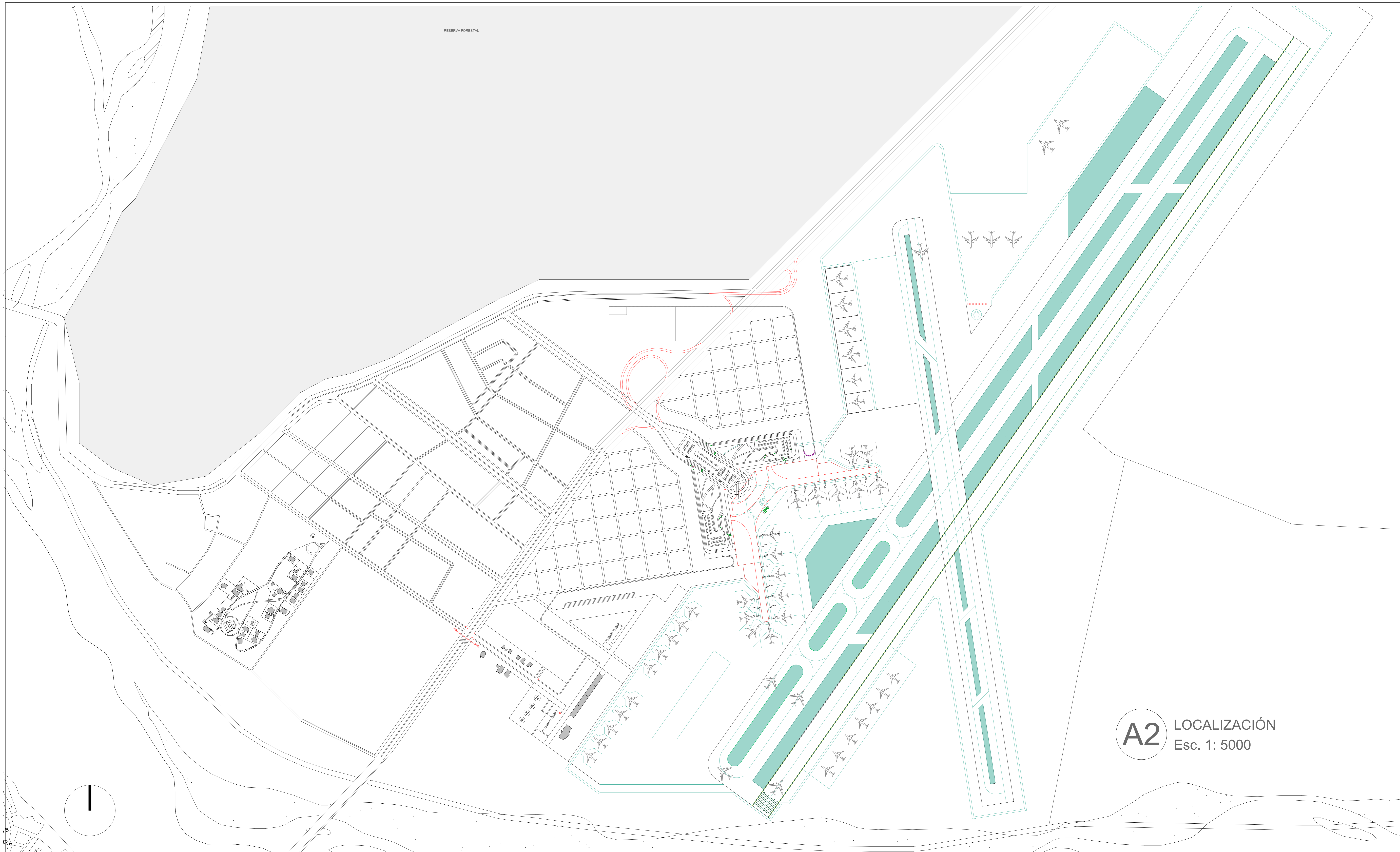
A2 LOCALIZACIÓN Esc. 1: 5000