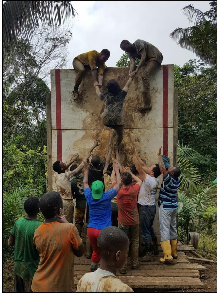
Figura 3. Actividad 1 de la empresa Land Art Design S.A.S, realizadas en el campamento SION, situado a las afueras de Quibdo.