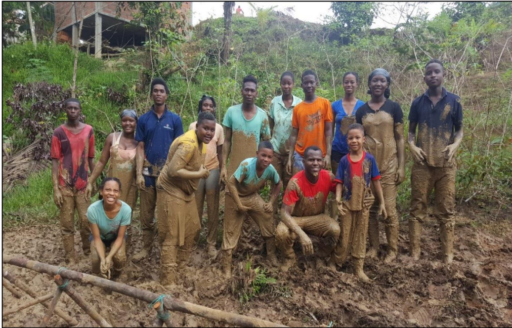
Figura 6. Actividad 3 de la empresa Land Art Design S.A.S, realizadas en el campamento SION, situado a las afueras de Quibdo.

que desborda en interés y amor por los seres humanos en la búsqueda común de trascendencia, significado y propósito.