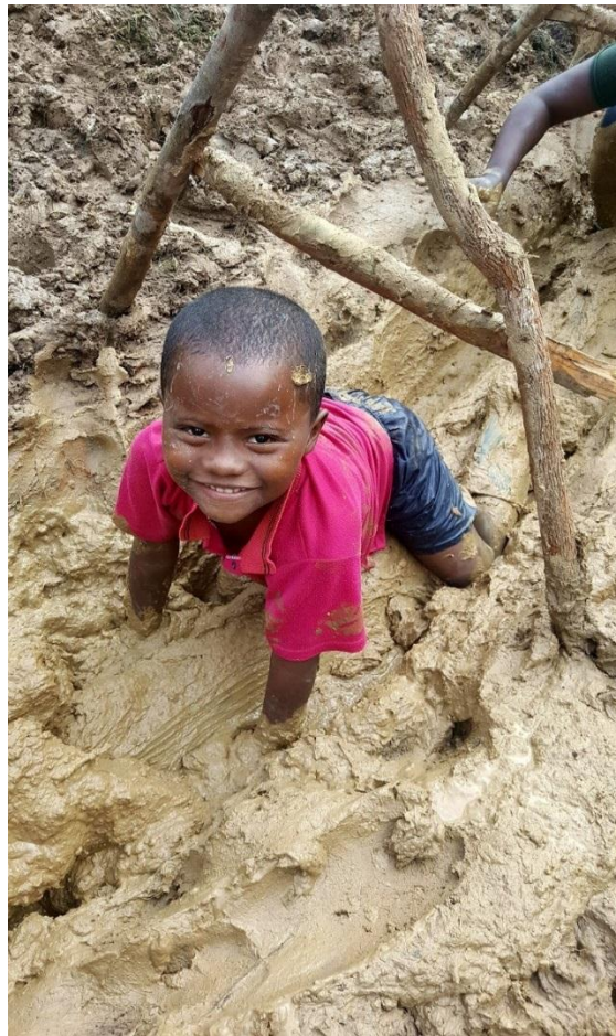
Figura 7. Actividad 4 de la empresa Land Art Design S.A.S, realizadas en el campamento SION, situado a las afueras de Quibdo.