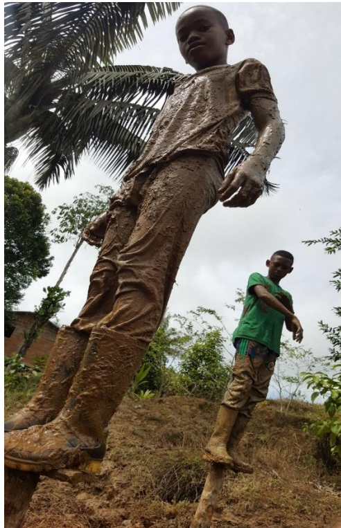
Figura 5. Actividad 2 de la empresa Land Art Design S.A.S, realizadas en el campamento SION, situado a las afueras de Quibdo.

Propósito. Va orientado a metas u objetivos claros que quieren resolver necesidades psicológicas en la comunidad objetivo (Novita - Chocó) aportando un sentido de logro , de unión y equidad . Adicional a lo anterior, también se identificaron las necesidades básicas, educación para la competitividad y además la compensación justa, beneficios que se transmiten en el contexto y seguridad en el porvenir. Para los empleados también es un punto de inspiración entender que se trabaja no solo por el lucro si no que lo que se hace tiene un propósito social, es un principio formador e inspirador.