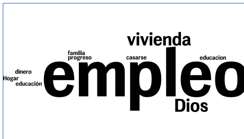
Figura 1. Conceptos repetitivos en las respuestas de las Encuestas

Según la página web de la gobernación del choco: “Chocó es el departamento más pobre de Colombia y su IDH es el menor del país también, siendo de 0,684 (medio) y comparándolo con países es similar al IDH que posee Bolivia” (Gobernación del Choco, 2018,p.1)