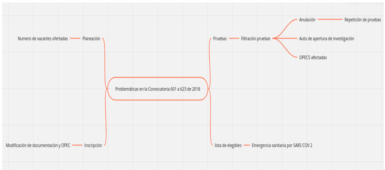
Problemáticas en la Convocatoria 601 a 623 de 2018