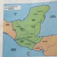
La geografía maya en la división política actual.