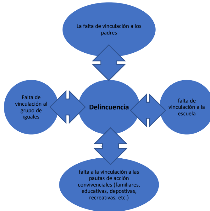
Figura 2. Variables que intervienen en la delincuencia juvenil

Fuente 2. Contextos de ruptura de vínculos sociales según Hirschi. Fuente: Garrido, Stangeland y Redondo, 2001. p. 221.