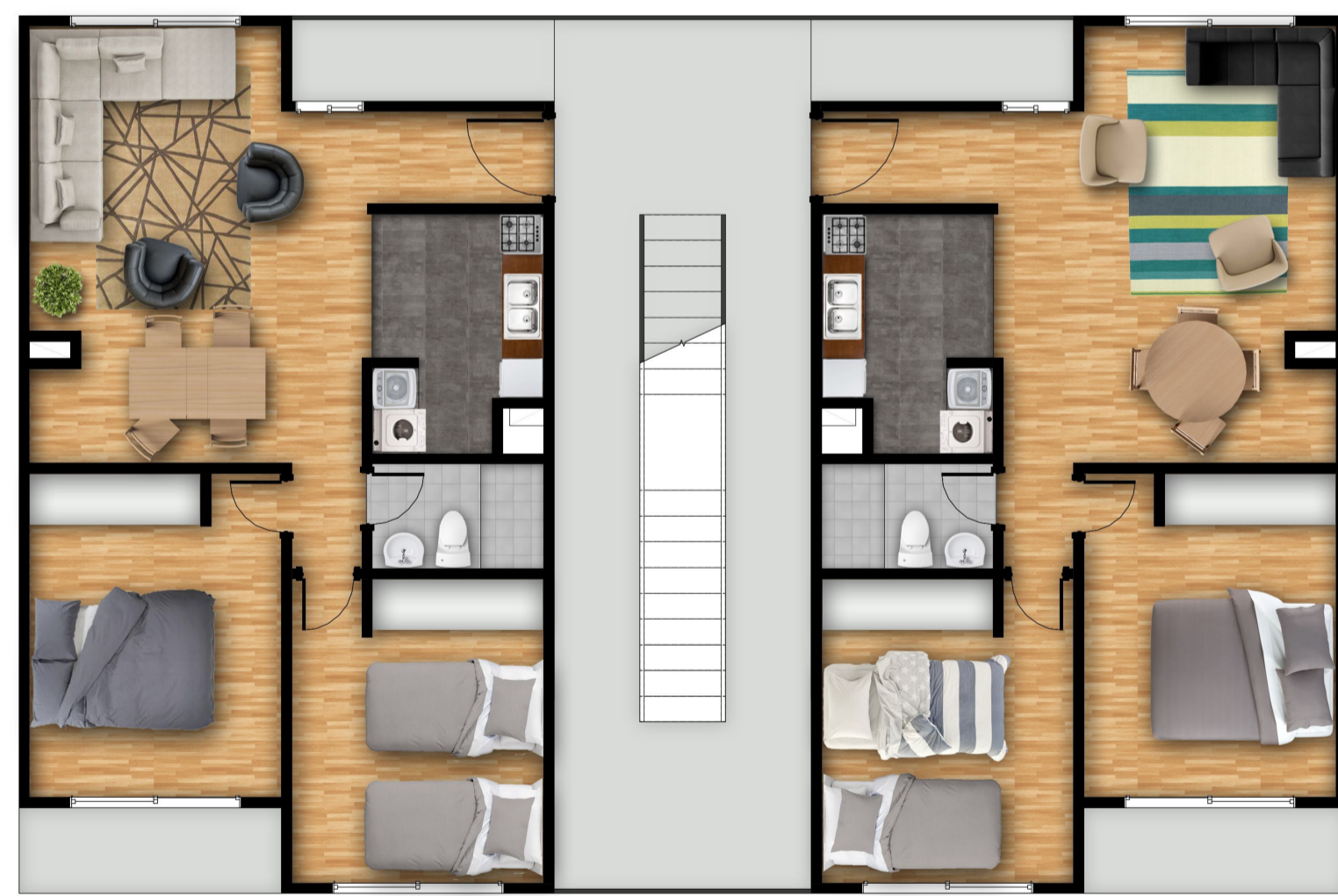
Planta Piso Par BLOQUE 54