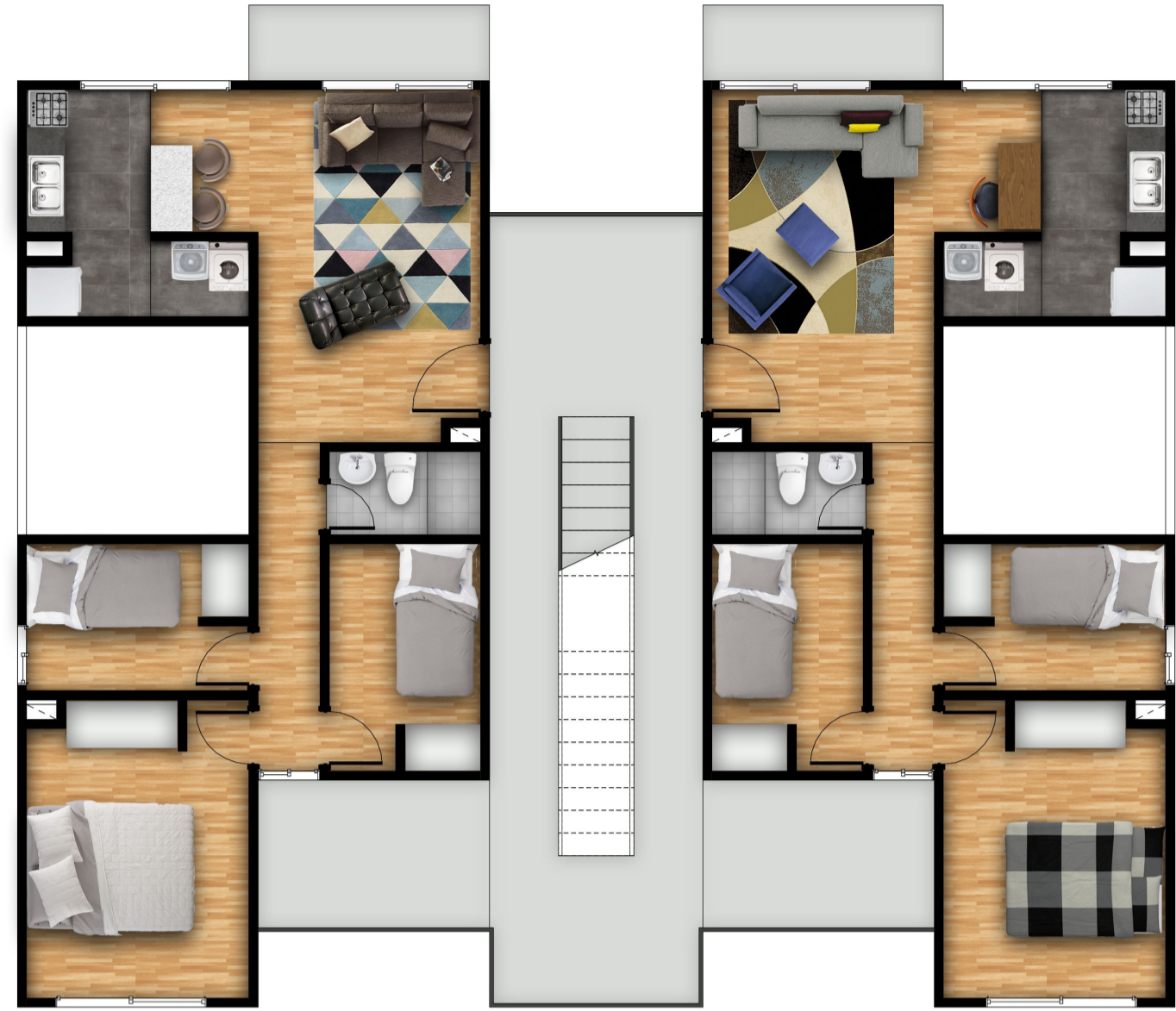
Planta Piso Impar BLOQUE 63