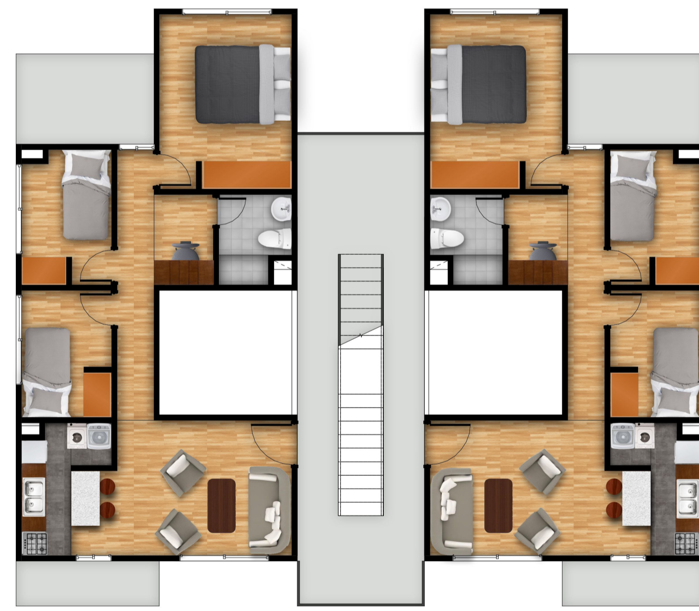
Planta Piso Par BLOQUE 63

NOTA : El diseño original no contempla las zonas de ampliación. las opciones disponibles se presentan en la plancha A-113