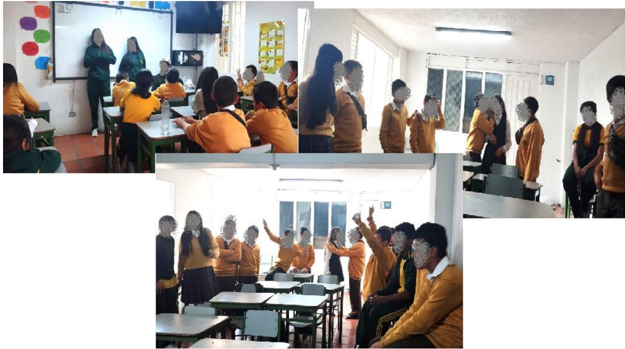
IMAGEN 6: Actividad Trabajadores por la paz "Teléfono roto".

El proceso con los estudiantes de octavo inició con la indagación por parte de los mismos acerca de las situaciones que se estaban presentando. Se entrevistó en primer lugar a los estudiantes venezolanos, quienes mencionaron que, en repetidas ocasiones, el estudiante señalado, hace comentarios negativos o peyorativos sobre ellos, aludiendo a que deben “regresar a su país”, que son unas “ratas”, de hecho, al momento de recibir el refrigerio escolar se hacen comentarios relacionados con el hambre y la única comida que reciben al día. Este elemento suscita risa en varias personas del salón y se ha presentado también por los grupos de estudiantes, en donde se comparten imágenes y comentarios como los que se muestran a continuación: