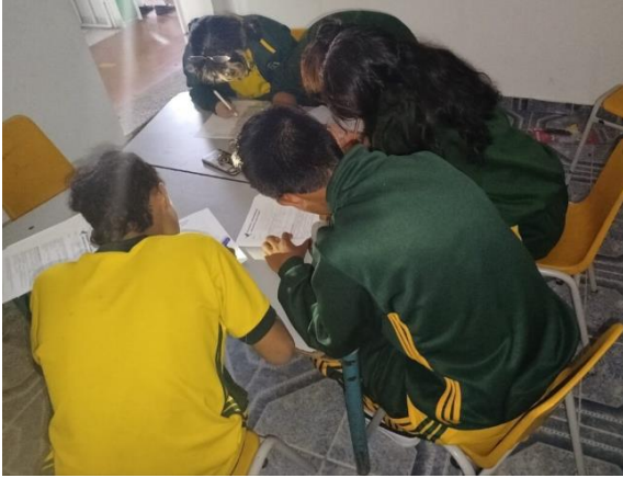
IMAGEN 1: Primer grupo de aplicación de encuestas a estudiantes de grupo Base