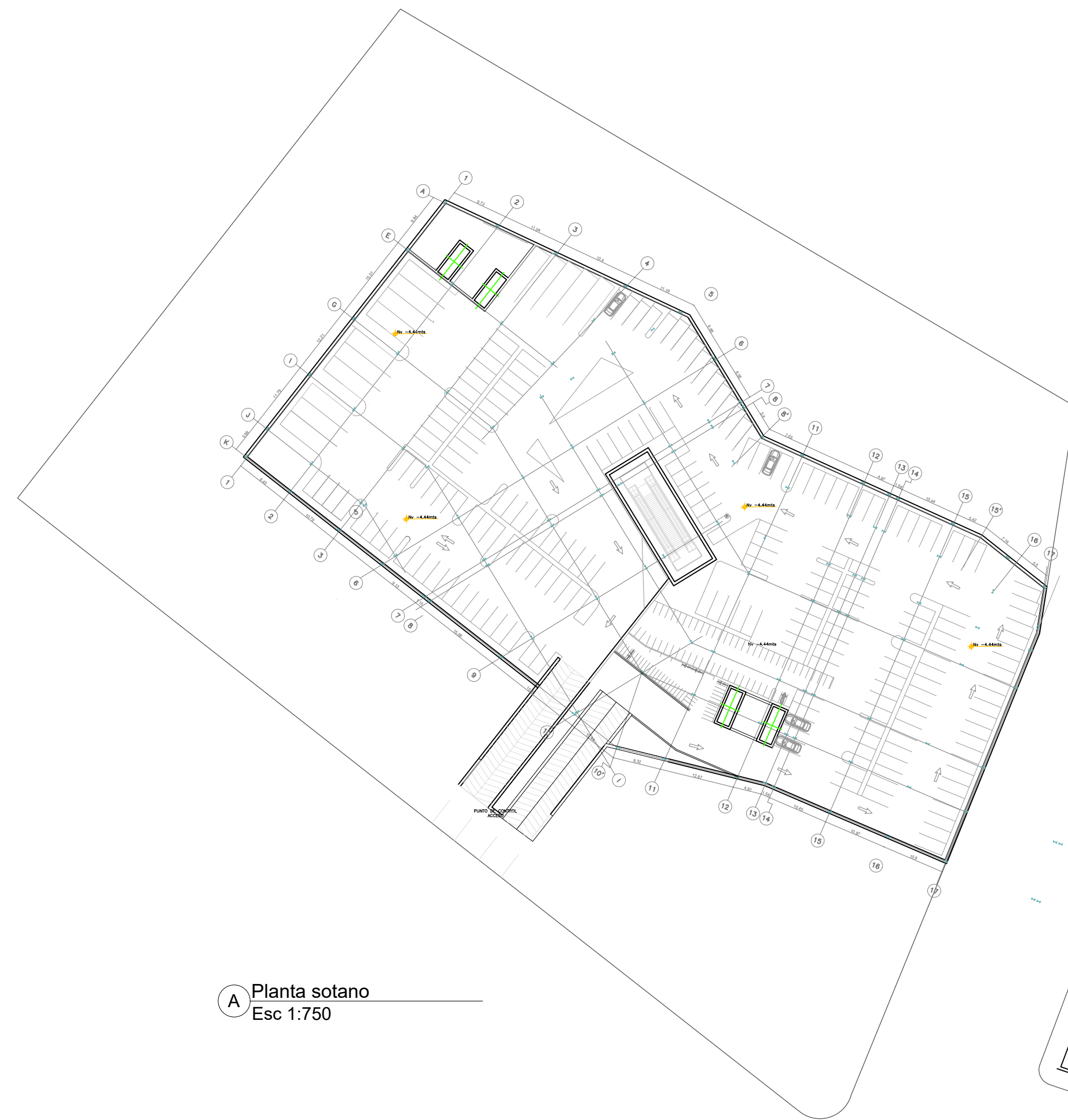
A Planta sotano Esc 1:750