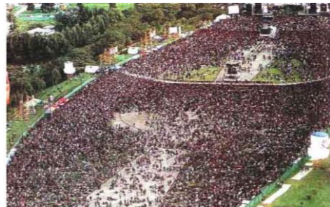
Imagen 4: Plaza de eventos Parque Simón