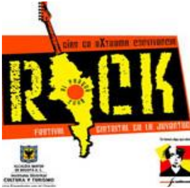
Imagen 1: Logo del Festival Rock