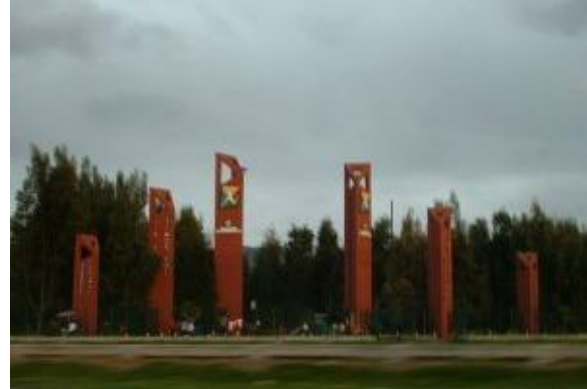
Imagen 2: Parque Metropolitano Simón Bolívar lugar donde se lleva a cabo el festival al Parque 2006