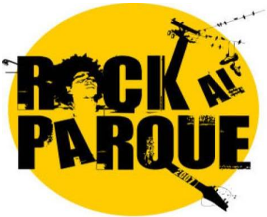
Imagen 3: Logo del Festival de Rock al Parque 2007 Bolívar en un día de Rock