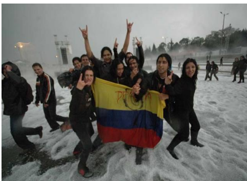
Imagen 5: Plaza de eventos del Parque Simón Bolívar durante la Granizada del día 3 noviembre