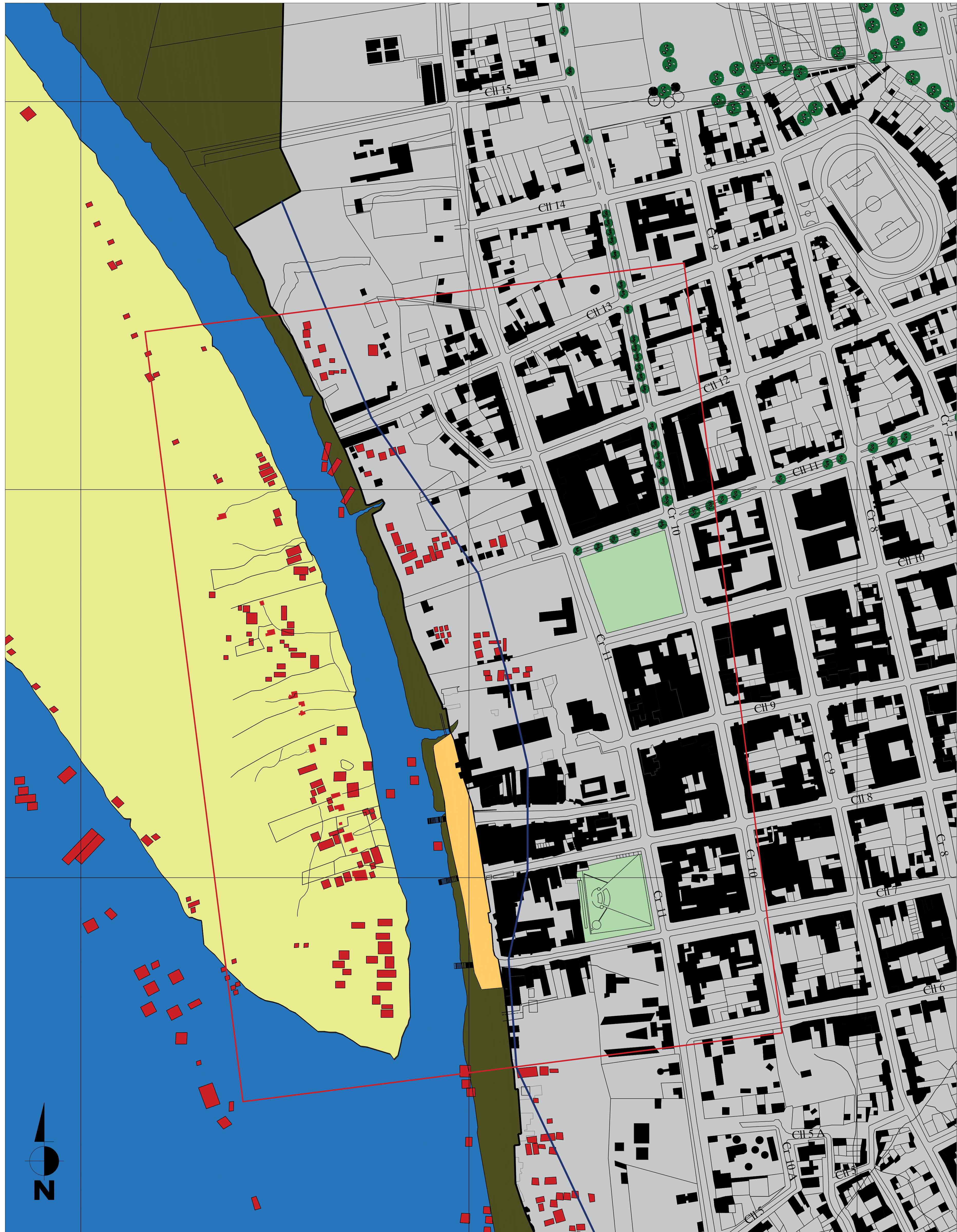
P3 LOCALIZACION LETICIA ESCALA 1: 2500