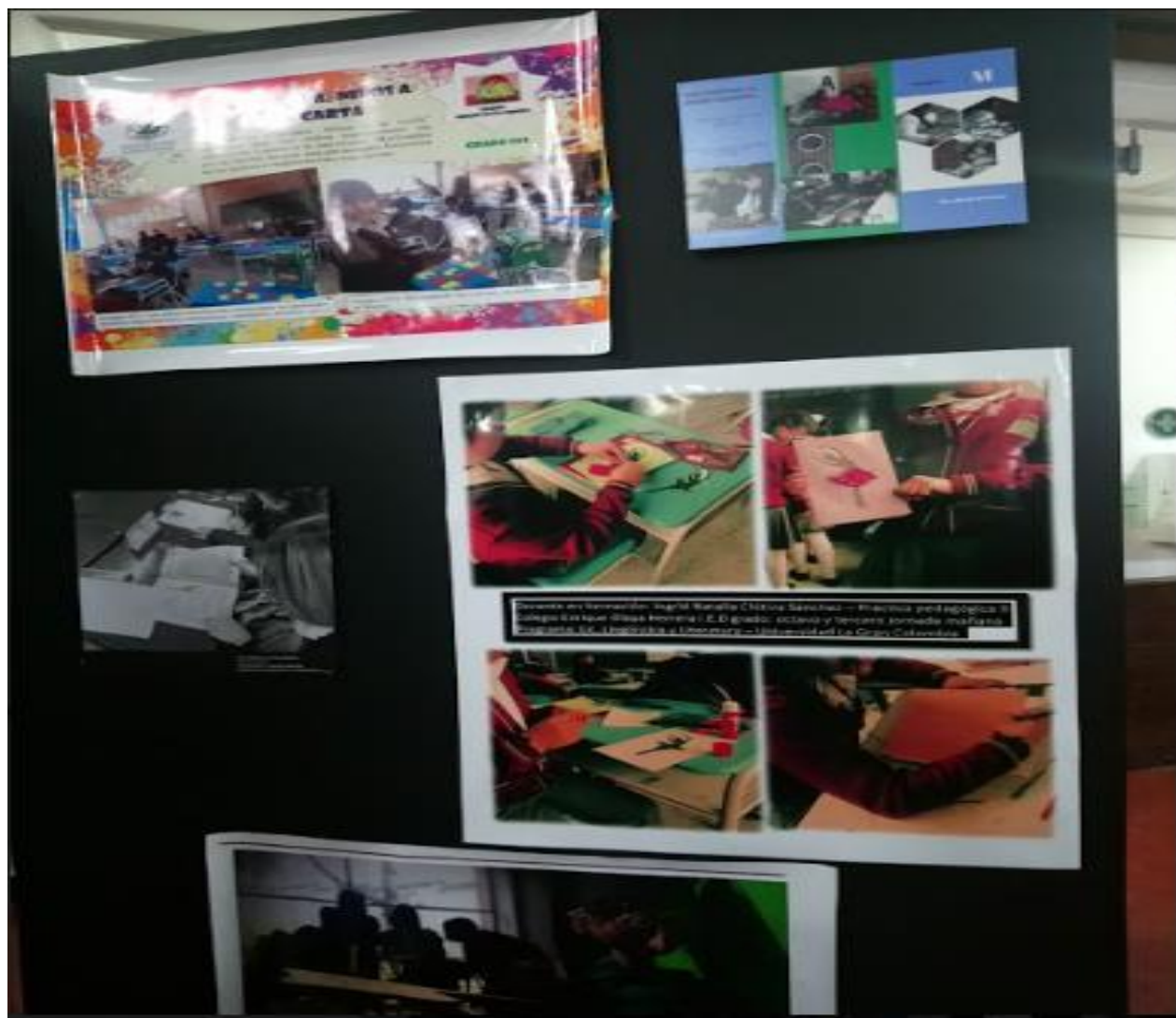
Exposición Retratos Maestros. Plazoleta Central Bloque J.