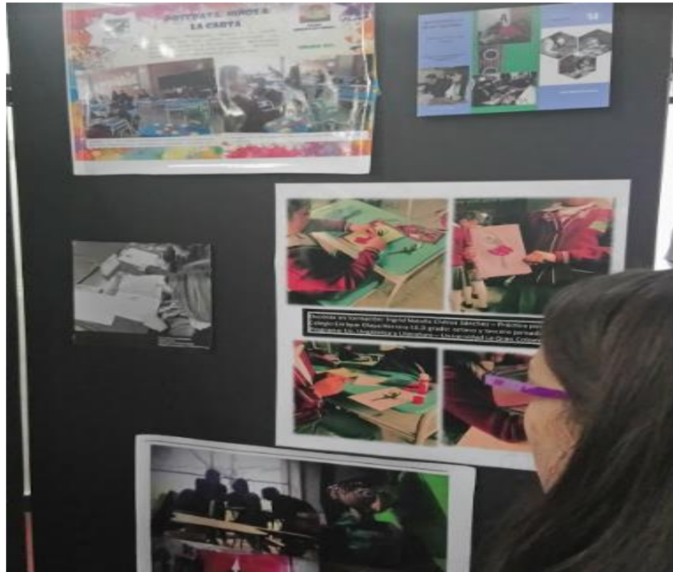
Visita de Estudiantes de la Facultad Exposición Retratos Maestros. Plazoleta Central Bloque J.