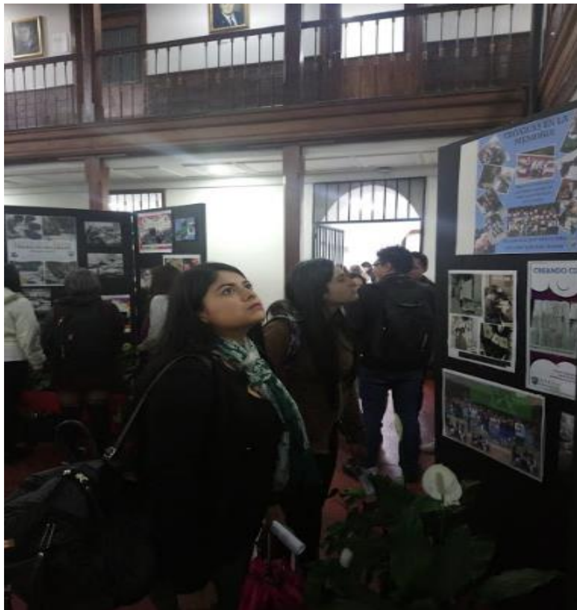
Exposición Retratos Maestros. Plazoleta Central Bloque J.