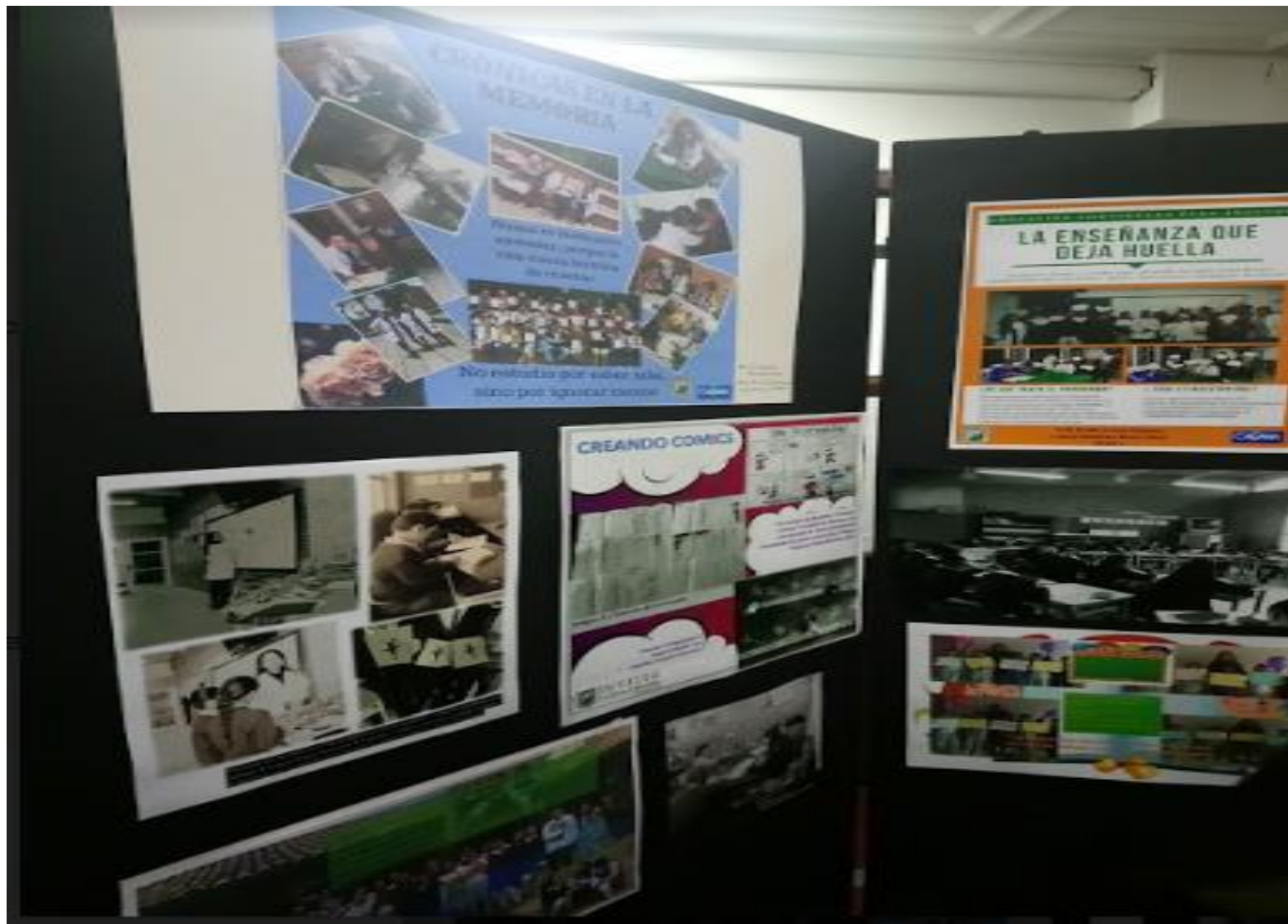
Diseño e implementación del material didáctico en los diferentes Centros de Práctica Exposición Retratos Maestros. Plazoleta Central Bloque J.