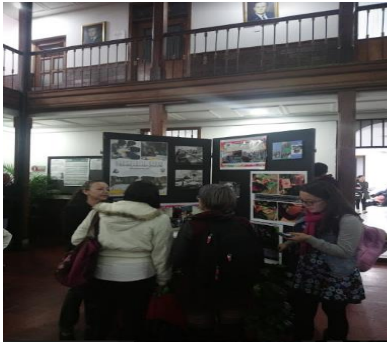
Visita de Estudiantes de la Facultad Exposición Retratos Maestros. Plazoleta Central Bloque J.