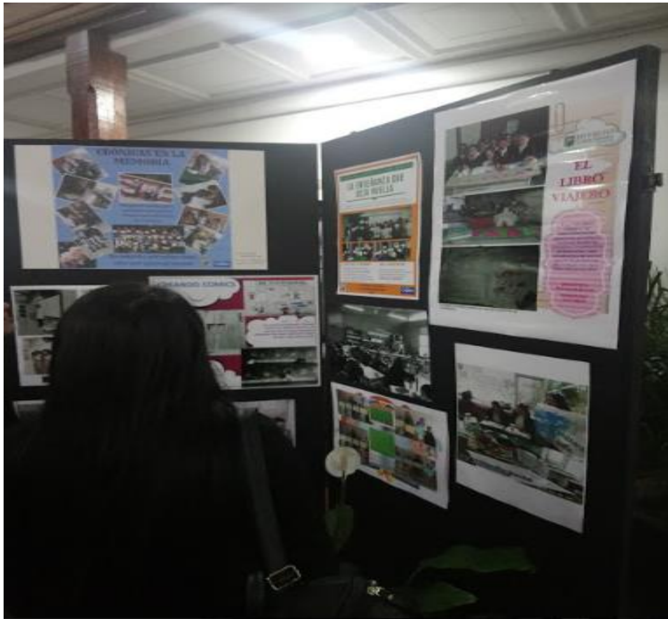
Exposición Retratos Maestros. Plazoleta Central Bloque J.