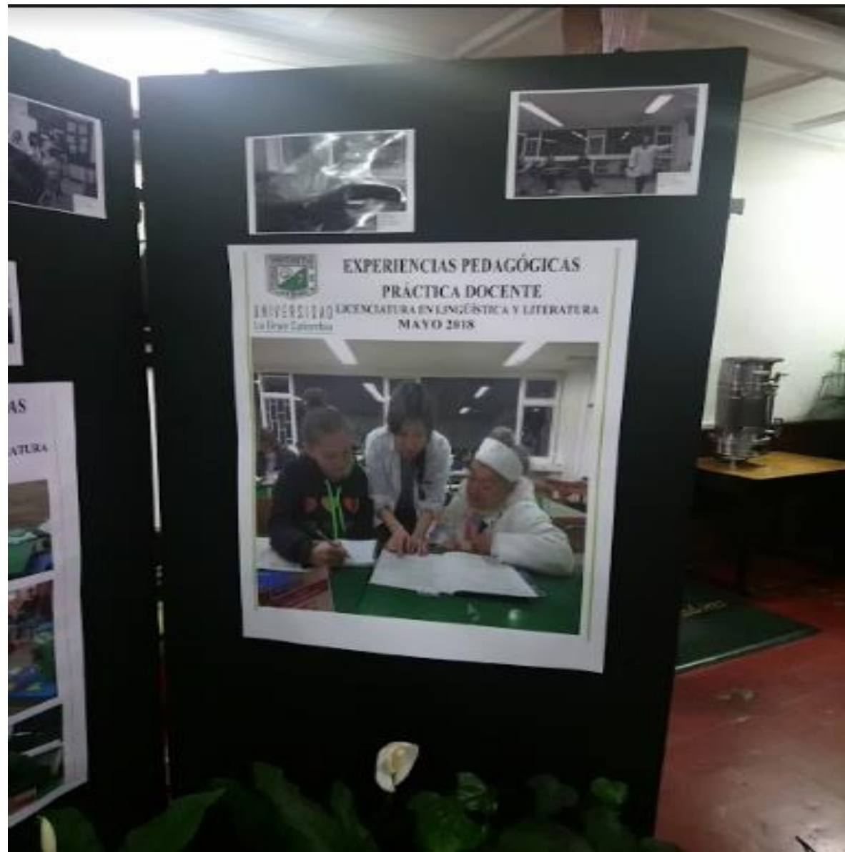
Experiencia de practica con adultos mayores, programa de formación continuada Cafam Exposición Retratos Maestros. Plazoleta Central Bloque J.