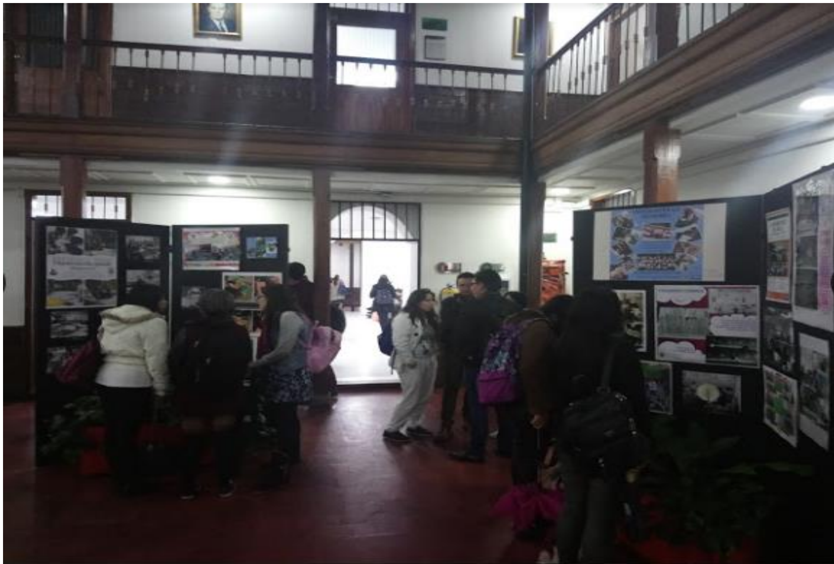
Exposición Retratos Maestros. Plazoleta Central Bloque J.