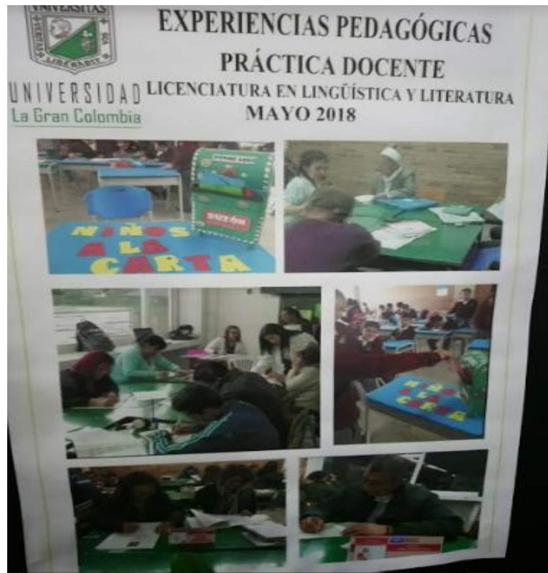
Diseño e implementación del material didáctico “Niños a la carta” Exposición Retratos Maestros. Plazoleta Central Bloque J.