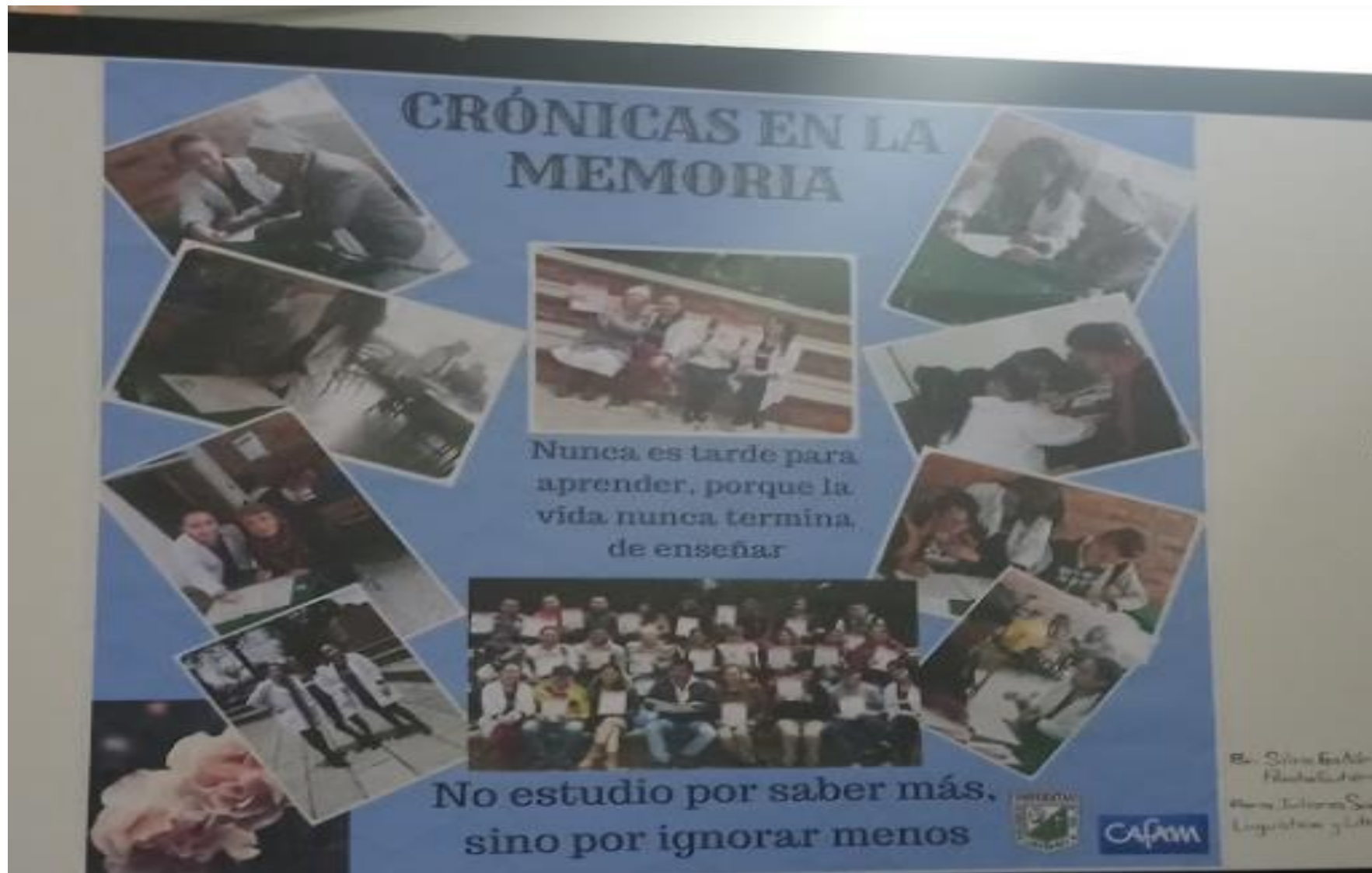
Experiencia de practica con adultos mayores, programa de formación continuada Cafam Exposición Retratos Maestros. Plazoleta Central Bloque J.