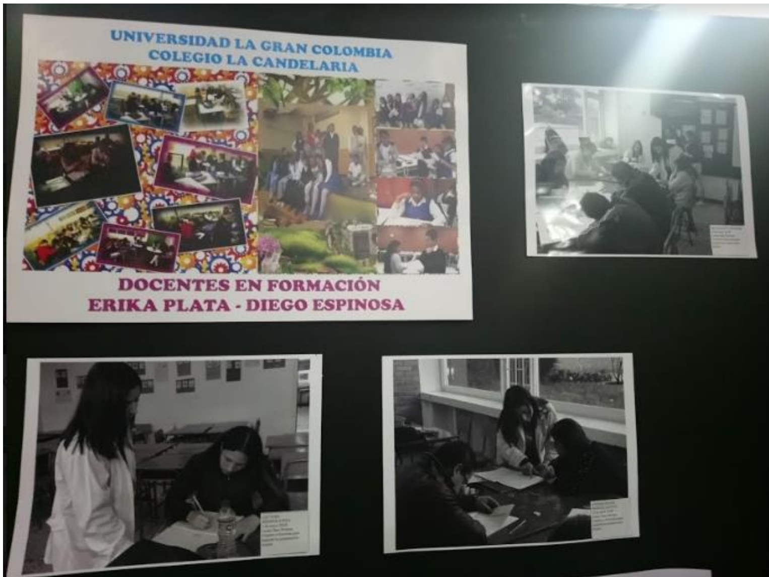
Experiencia de práctica La Candelaria IED Exposición Retratos Maestros. Plazoleta Central Bloque J.