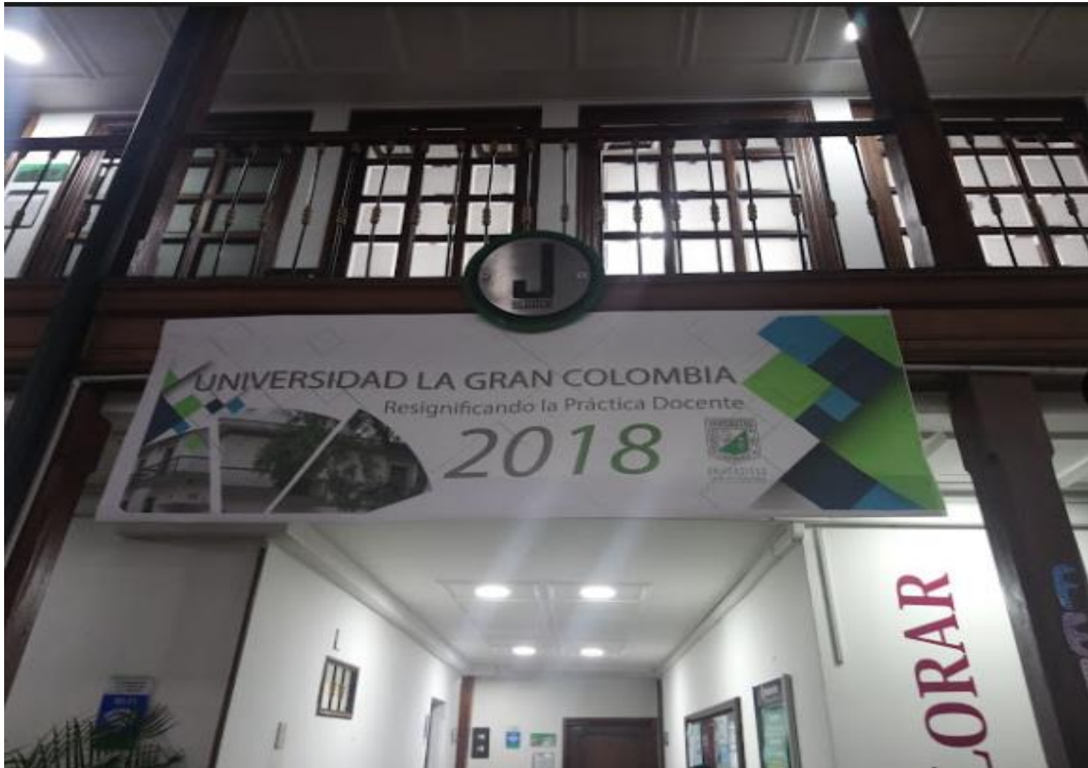
Apertura del Evento Exposición Retratos Maestros. Plazoleta Central Bloque J.