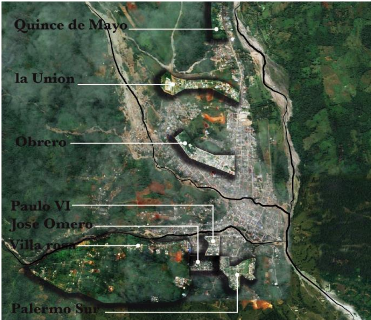
Ilustración 3 Localización de los barrio estudiados en el Municipio. Edición Propia (Salas J. Semillero de Investigación, TEPEs, 2019)

Como se puede observar la ciudad se ubica sobre el cauce del rio Mocoa que desprende dos quebradas llamadas el rio Sangoyaco y el rio Mulato. Algunos de los barrios limitan con estas cuencas hídricas dejándolos en un alto riesgo de repetir catástrofes ambientales y evidencia la necesidad de una adecuada planeación del municipio.