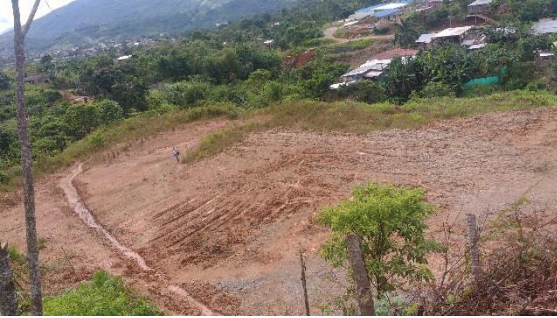
Foto 4: Terreno Asentamiento Villa Rosa para futura cancha deportiva.