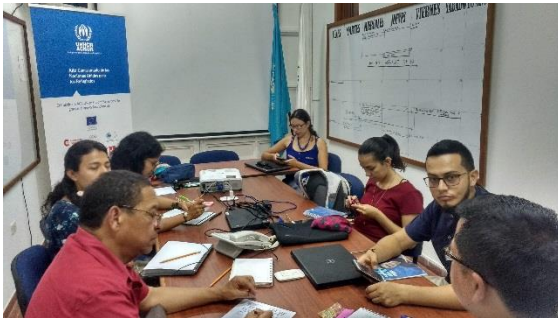
FOTO 2: Reunión grupo Universidad La Gran Colombia con representantes de ACNUR y la Corporación Opción Legal.