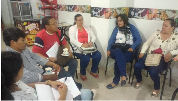
FOTO 1: Trabajo en subgrupo en el Taller organizado con líderes de barrios urbanos y representantes de la Universidad La Gran Colombia.