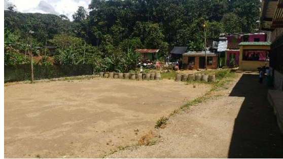
Foto 5: Terreno Asentamiento Paraíso para futura cancha deportiva