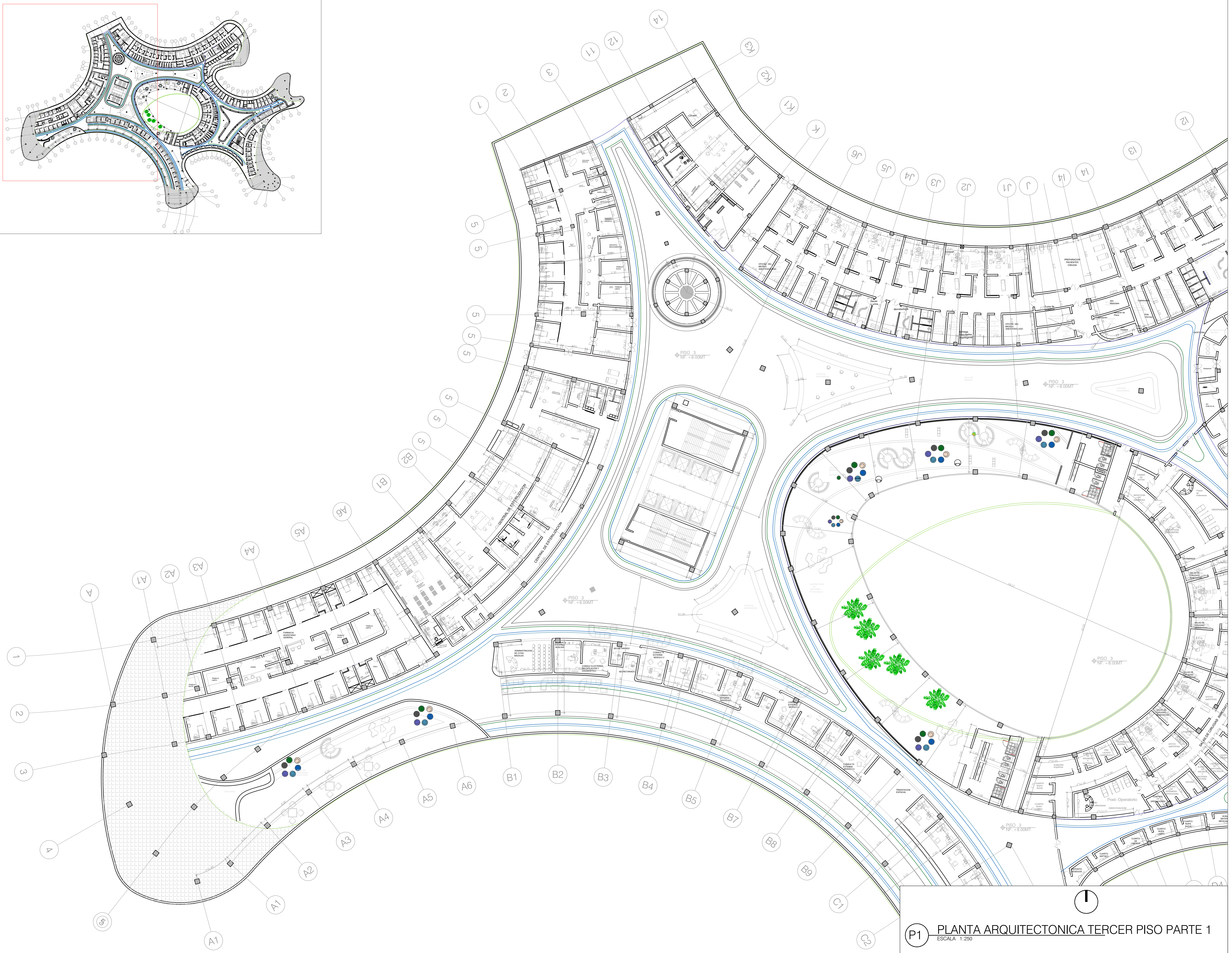
P1 PLANTA ARQUITECTONICA TERCER PISO PARTE 1 ESCALA 1:250