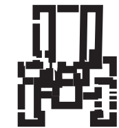
Planta en H

Es la planta que adecuo el hospital para cubrir la demanda que requería en la atención a pacientes.