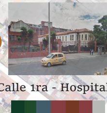
Calle 1ra - Hospital

El color varía entre los blancos y ocres o en algunos casos esta también presente el color ladrillo, además de los verdes presentes en el jardín y las zonas verdes.