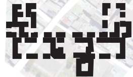
Planta en U

La planta de pabellón se caracteriza por su volumetria rectangular central de gran logitud de dos pisos.