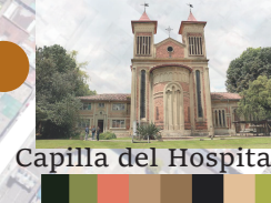
Capilla del Hospital