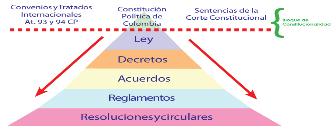
Figura No. 2. Jerarquía de las normas en Colombia.