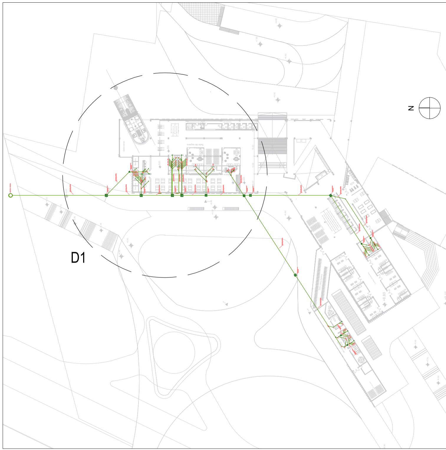
A RED DE DESAGUES ESC. 1:1250