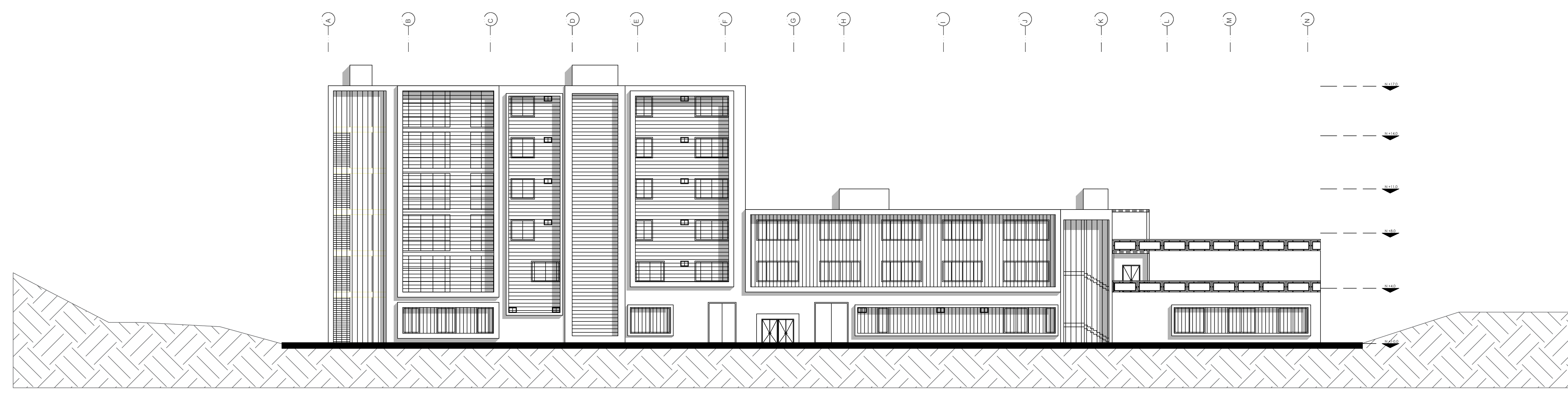
A12 Fachada Norte ESCALA 1:200