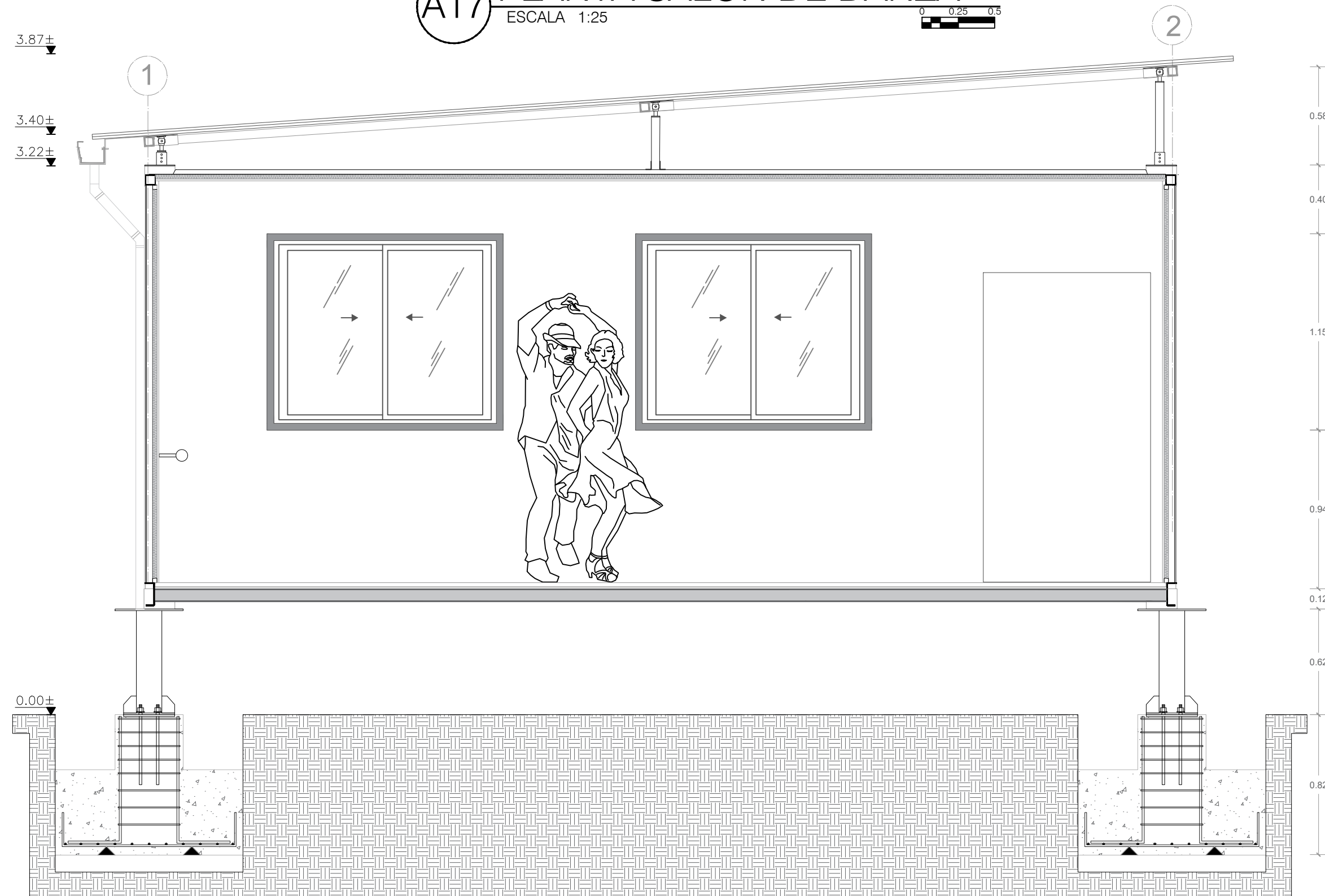
C30 CORTE TRANSVERSAL ESCALA 1:25