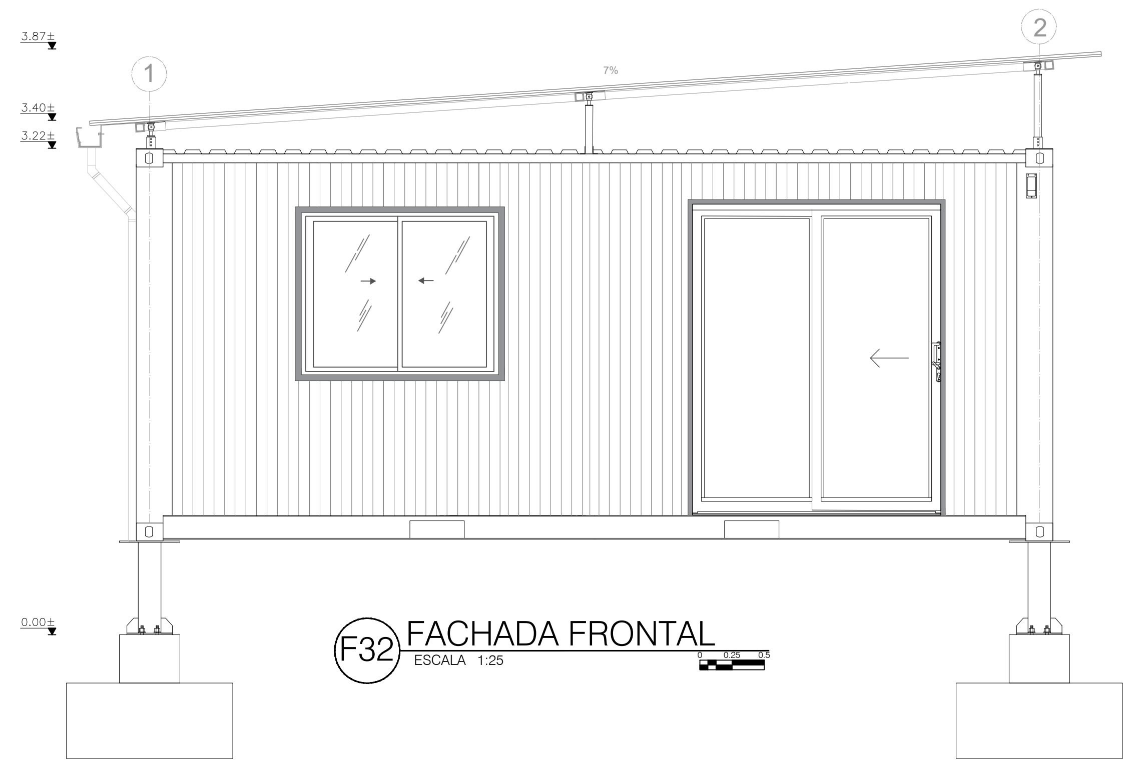
F32 FACHADA FRONTAL ESCALA 1:25