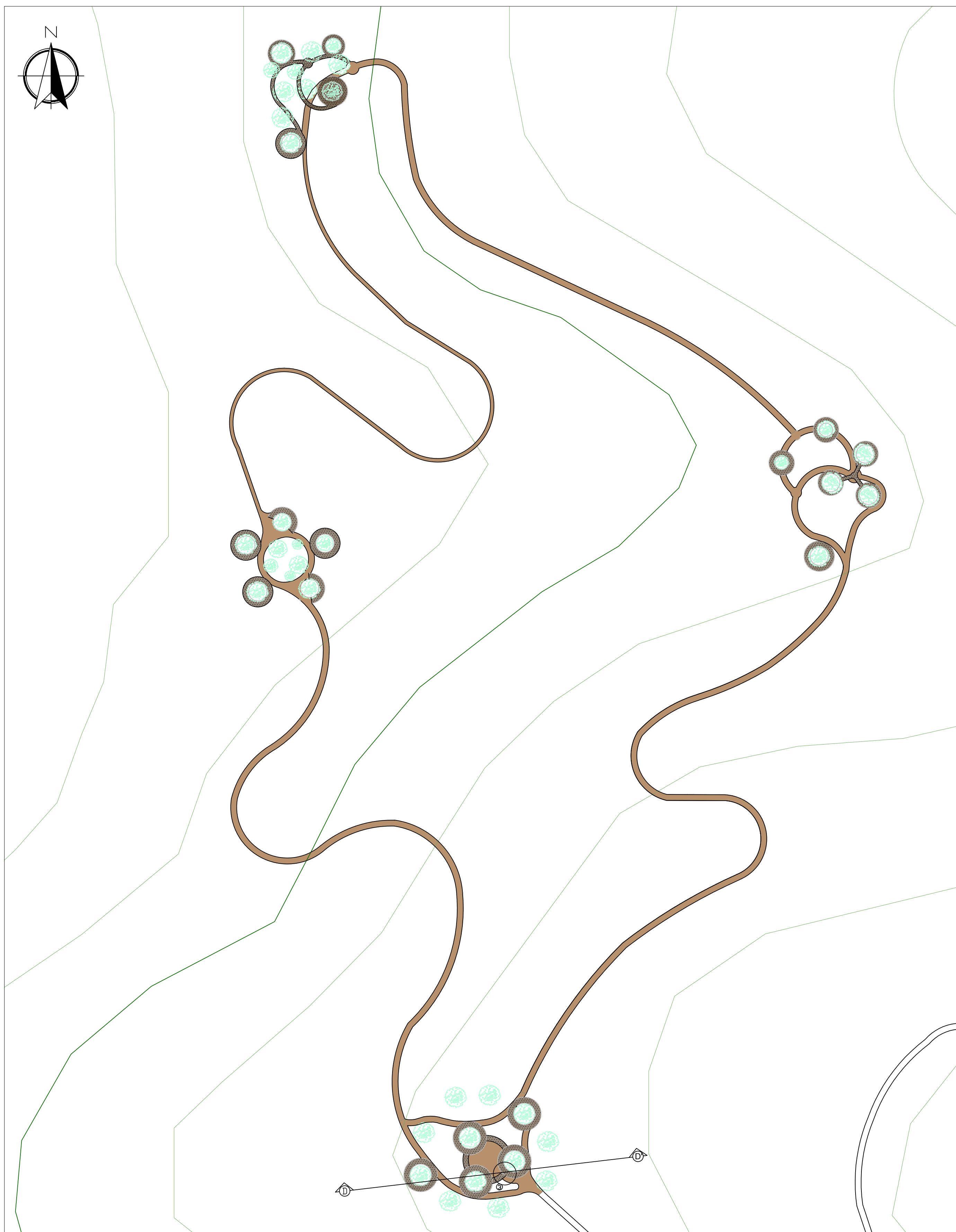
A4 ESPACIO ESPECÍFICO 2 ESC: 1:1000