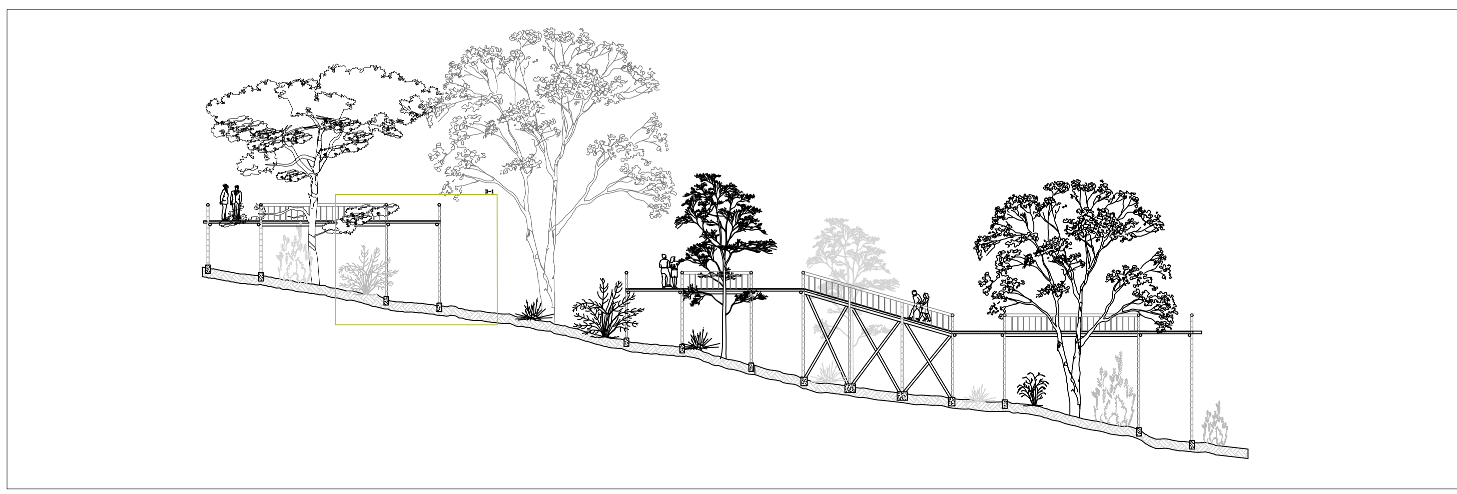
C4 CORTE D - D' ESC: 1:200