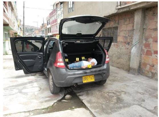
IMAGEN 04: PLANO MEDIO VEHICULO POSTERIOR LATERAL IZQUIERDO, PUERTAS Y BAUL ABIERTO, ENCONTRANDOSE TRES BOLSA NEGRAS ENUMERADAS 3,4 Y 5, OCCISO ENUMERADO CON 1, VEHICULO ENUMERADO 2 .