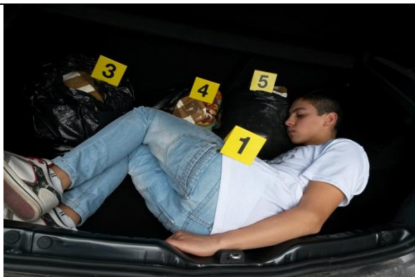
IMAGEN 05: PRIMER PLANO ELEMENTOS MATERIALES PROBATORIOS ENUMERADOS, OCCISO NUMERO 1, BOLSAS DE BASURA ENUMERADAS 3,4 Y 5.