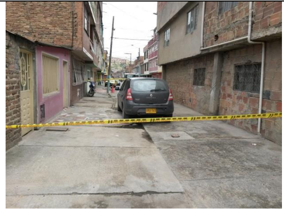
IMAGEN 02: PLANO GENERAL POSTERIOR, FOTOGRAFIA COMPLEMENTARIA A LA ANTERIOR, SE APRECIA VEHICULO DE PLACAS URU 763 CERCA A EL HOSPITAL LA MISERICORDIA