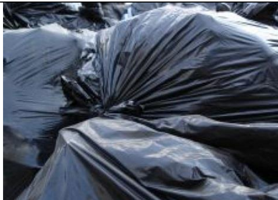
IMAGEN 07: PRIMER PLANO BOLSAS NEGRAS LAS CUALES CONTIENEN EL POLVO BLANCO DEBIDAMENTE EMBALADAS.