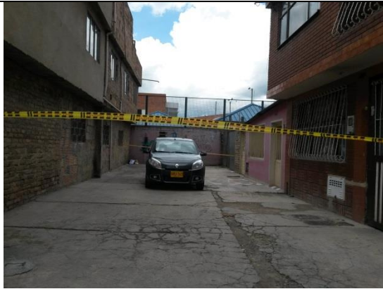
IMAGEN 01: PLANO GENERAL FRONTAL, SE APRECIA EL MOMENTO EN QUE SE INICIA EL ACORDONAMIENTO DEL LUGAR