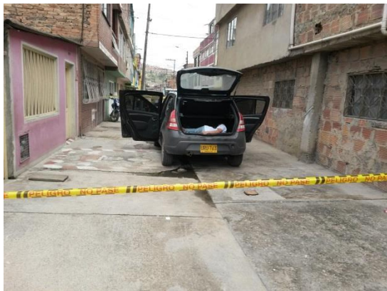
IMAGEN 03: PLANO GENERAL VEHICULO CON PUERTAS Y BAUL ABIERTO, ENCONTRANDOSE TRES BOLSAS NEGRAS Y UN CUERPO SIN VIDA.