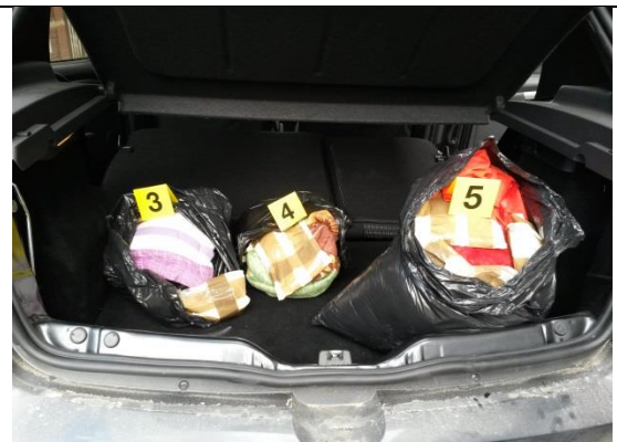
IMAGEN 06: PRIMER PLANO BOLSAS DESTAPADAS EVIDENCIANDO UN POLVO BLANCO, CADA BOLSA ENUMERADA 3, 4 Y 5