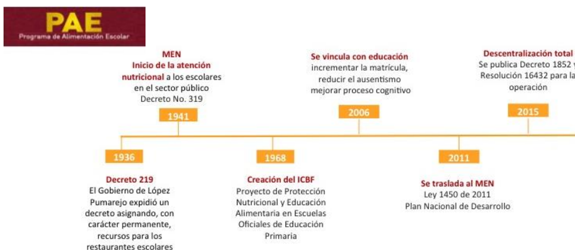
Figura 1. La grafica demuestra los antecedentes y transición del Programa de Alimentación escolar.

El proceso de alimentación escolar nace por iniciativa del entonces presidente de la República Alfonso López Pumarejo en el año 1936, quien asigna de carácter permanente los recursos para restaurantes escolares. Desde 1941 es responsabilidad del Ministerio de Educación Nacional la atención nutricional de los niños y niñas del sector oficial, fijando la asignación de los recursos para dotación de restaurantes escolares, es así su articulación con otras entidades como el Instituto Colombiano de Bienestar Familiar ICBF y como se muestra en el grafico 1 la línea en el tiempo frente al proceso P.A.E. (Ministerio de Educación Nacional, 2016).