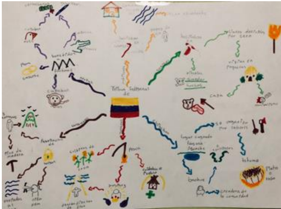
Ilustración 4. Estudiante 9. Rejilla de observación 2