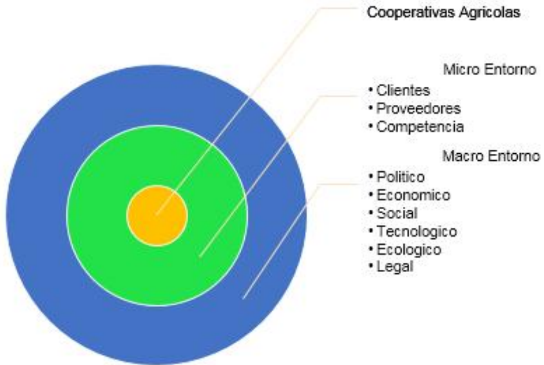
Ilustración 1 Entorno micro y macro económicos de Cooperativa agrícola