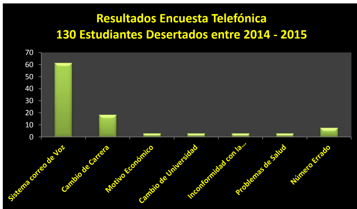
Tabla 2: Resultados Encuesta telefónica a Estudiantes Desertores entre 2014-2015

Observando los resultados que arrojó el test, se observa que la tendencia en el programa de Licenciatura en Inglés, maneja esta tendencia, permitiendo reconocer que si no existe la implementación de un sistema de gestión que piense, reflexione y ponga en práctica una solución, la deserción en el programa podría aumentar sus niveles.