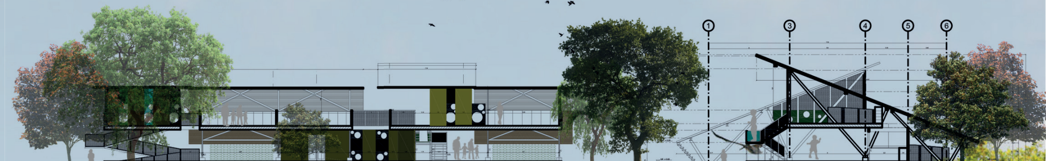
A Corte Longitudinal Esc. 1:1