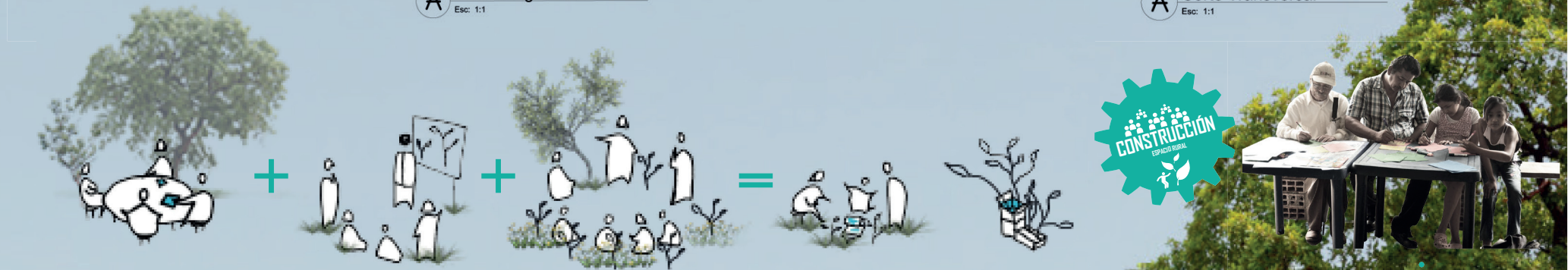
A Corte Transversal Esc. 1:1

Componente social de desarrollo y planificación participativa + Educación rural como conformador del espacio comunal = Resultados de integración social como semilla para el futuro + Trabajo colectivo de diseño de habitat rural con la población