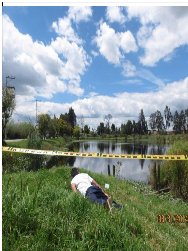
Panorámica se observa el lugar de los hechos