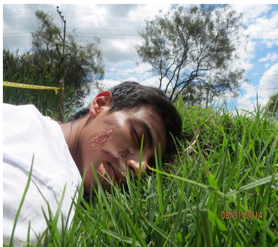
se evidencia multiples heridas de borde irregulares en rostro y en brazo ,antebrazo derecho