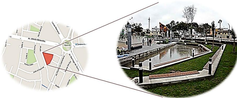
Imagen No. 8. Localización Santiago de Surco

Es un parque moderno de reciente creación que se encuentra en la avenida Ayacucho, en una zona céntrica de esta ciudad peruana y a 20 minutos de la catedral.