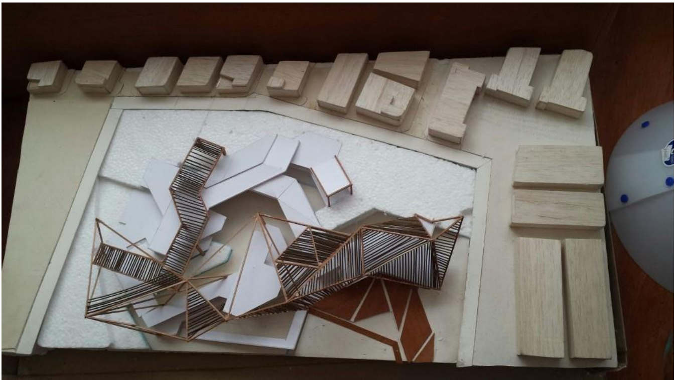
PROCESO VOLUMETRICO MAQUETA ESC 1:500