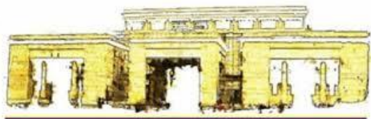
CONSEJO DE ESTADO REPÚBLICA DE COLOMBIA

Expediente No. 25000-23-27-000-2001-90479-01(AP)