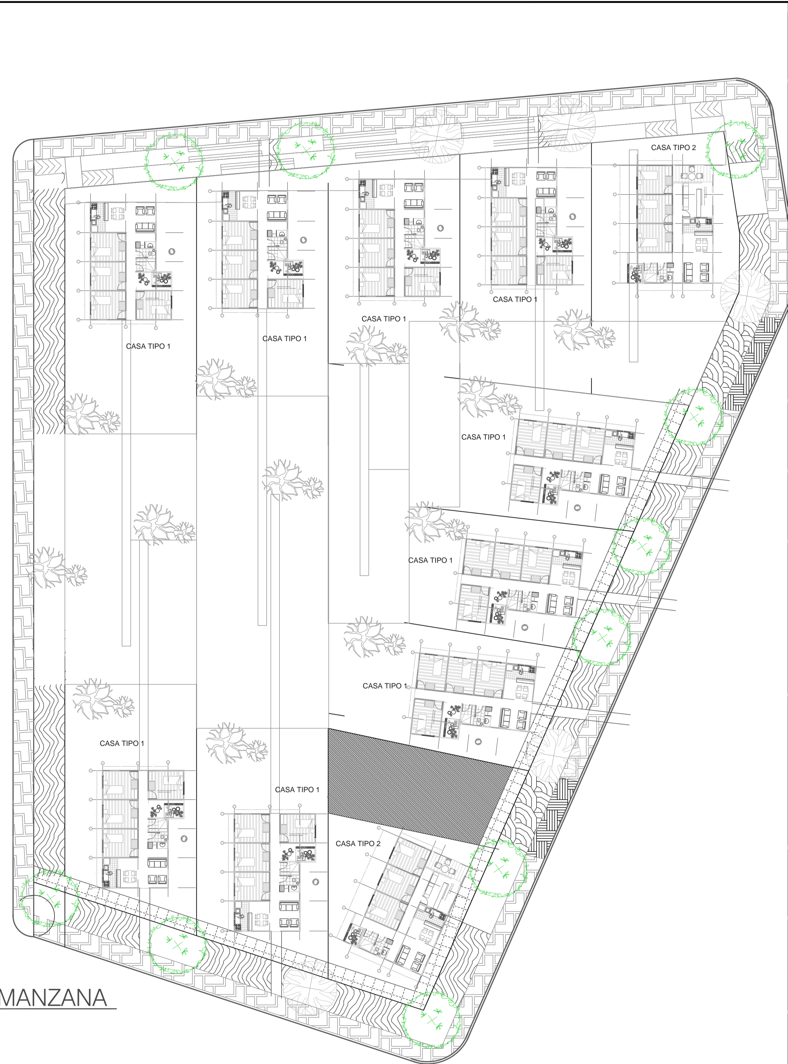
11 IMPLANTACIÓN DE MANZANA ESCALA 1:150