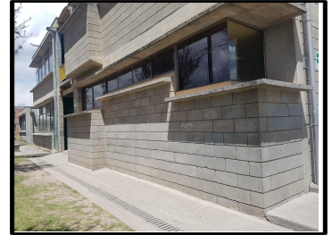
imagen 2