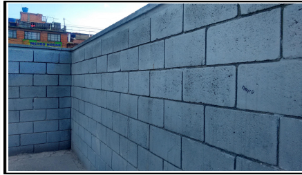
imagen 1

imagen 2-3: En sus dos fachadas se puede presentar de forma más leve la presencia de erosión en comparación con la imagen 1.