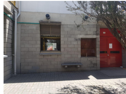
Imagen 3

En cuanto a su diseño que pudiera disminuir el contacto directo con agentes atmosféricos o la lluvia. Además cabe resaltar el mantenimiento inadecuado que pudo ocasionar el desprendimiento de las partículas de los bloques