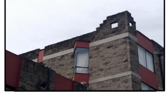
Imagen 2