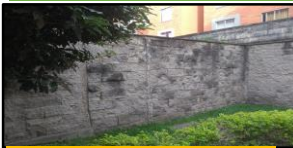
Imagen 5