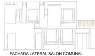
FACHADA LATERAL SALON COMUNAL