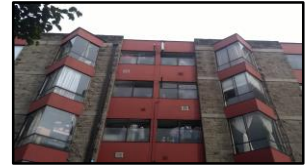
Imagen 4