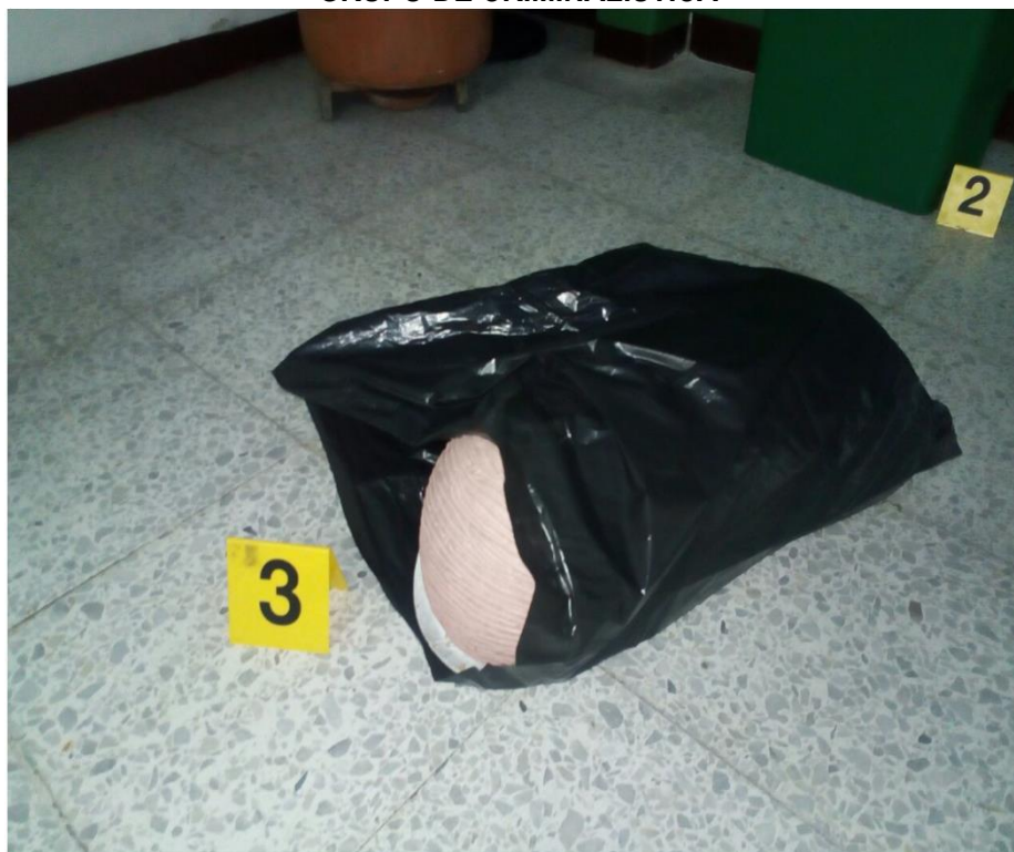
IMAGEN NUMERO 07

IMAGEN NO 07: PRIMER PLANO: SE OBSERVA EL EMP 3 EL CUAL SE CORRESPONDE AL CUERPO DEL RECIEN NACIDO ENCONTRADO EN LAS DENTRO DE LA BOLSA PLASTICA