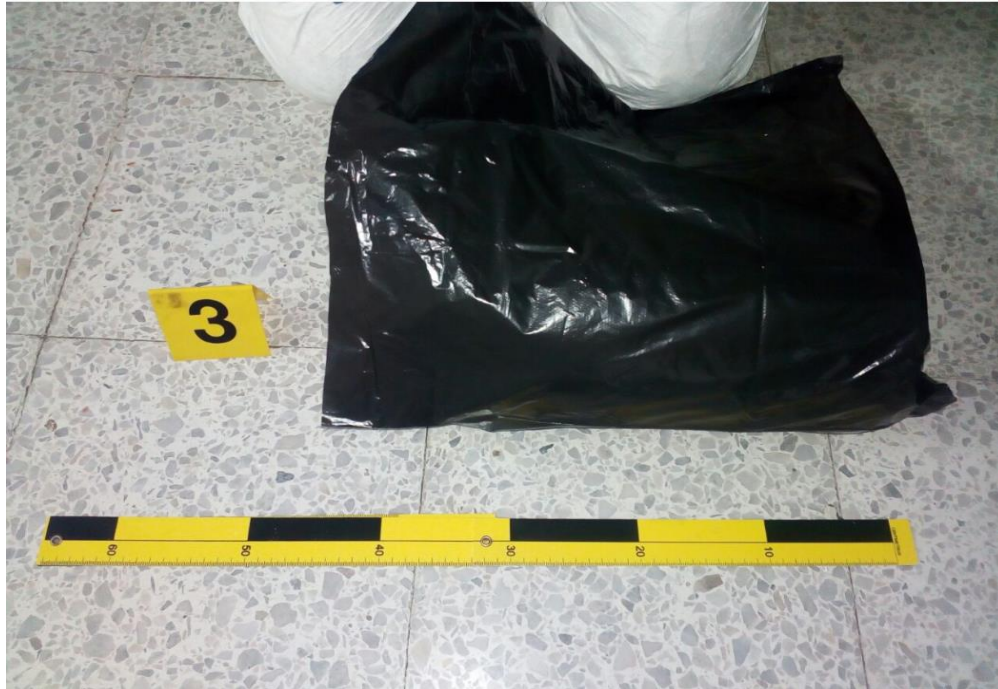
IMAGEN NUMERO 06

IMAGEN NO 05: PLANO MEDIO: SE APRECIA LA BOLSA PLASTICA NEGRA CON UNA MEDIDA APROXIMADA DE 40 CMS DE ANCHO Y EN SU INTERIOR EL CUERPO DE UN RECIEN NACIDO TOTALMENTE ENVUELTO EN UNA COBIJA.