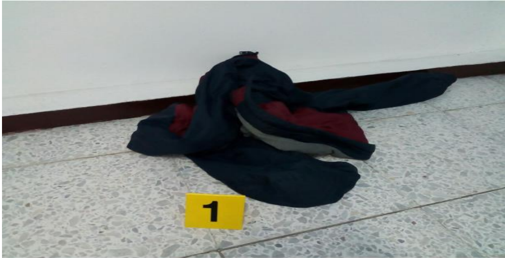
IMAGEN NUMERO 08

IMAGEN No 09: PRIMER PLANO: SE OBSERVA EL EMP 1 EL CUAL SE CORRESPONDE A UNA PRENDA DE VESTIR EN TELA ES UNA CHAQUETA PARA HOMBRE COLOR AZUL GRIZ Y ROJO SIN MARCA Y SIN TALLA.