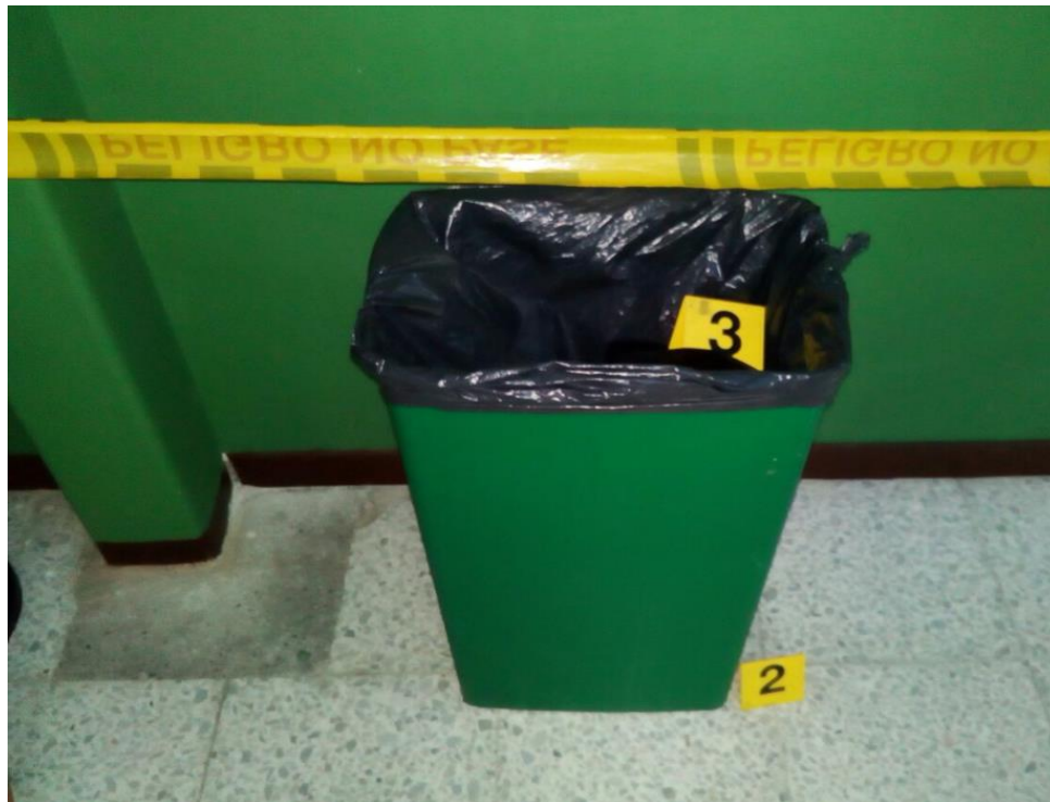
IMAGEN NUMERO 03