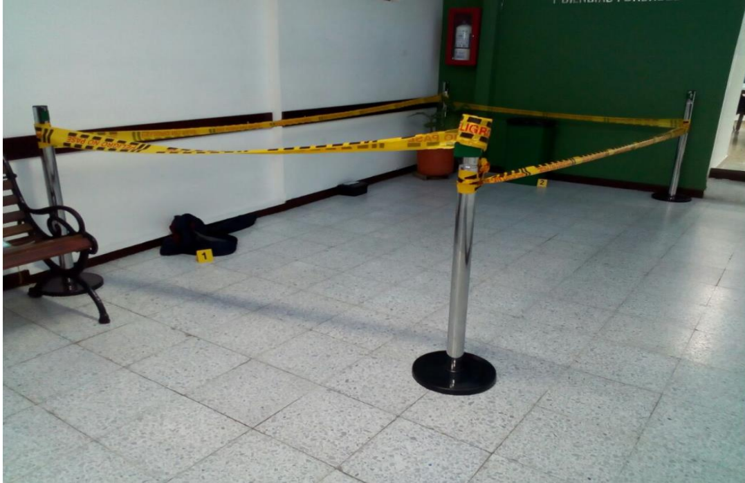
IMAGEN NUMERO 01

IMAGEN No.01. : PANORAMICA: CARACTERISTICAS DEL LUGAR, EL CUAL CORRESPONDE A LA CALLE 141 No. 112 B 17 BARRIO Suba Lombardía, ZONA RESIDENCIAL, SE OBSERVA ACORDONADO Y PROTEGIDO CON CINTA PLASTICA.