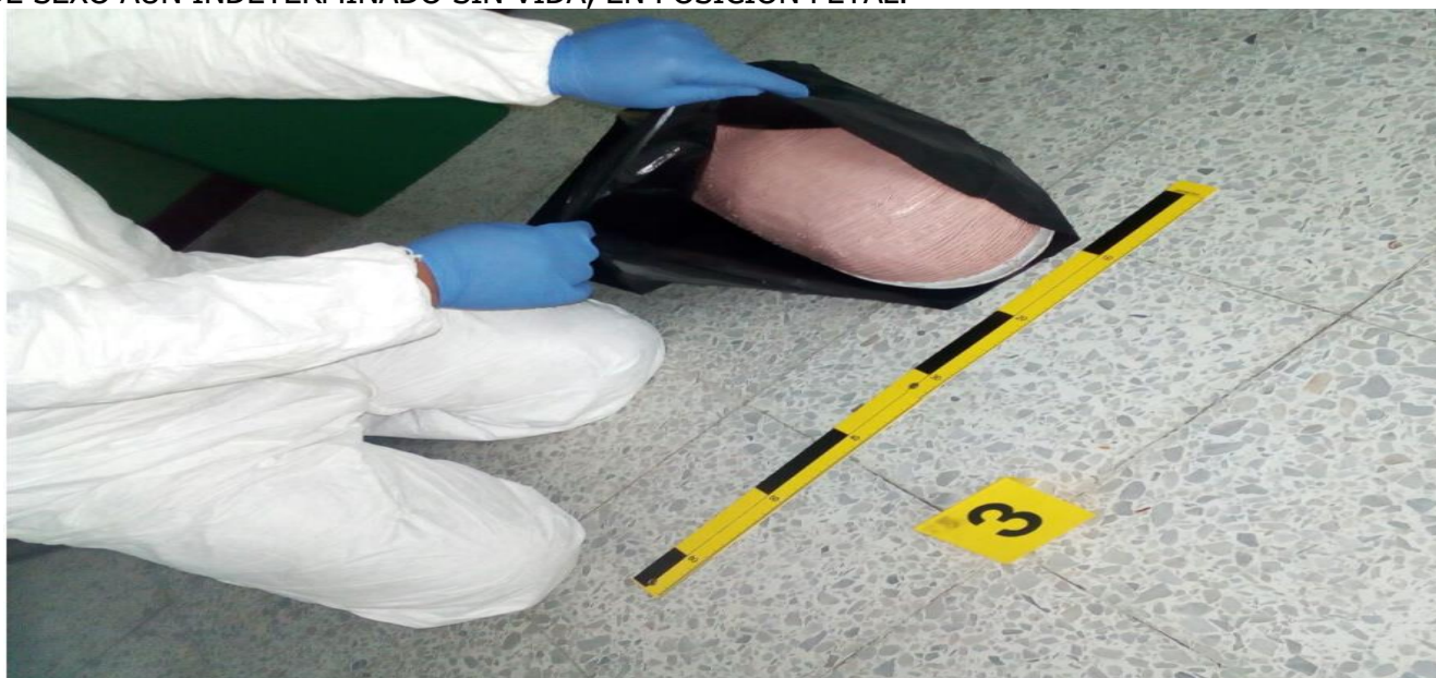
IMAGEN NUMERO 05

IMAGEN NO.04: PLANO MEDIO: SE APRECIA UNA CESTA DE BASURA Y EN SU INTERIOR UN RECIEN NACIDO DE SEXO AUN INDETERMINADO SIN VIDA, EN POSICION FETAL.