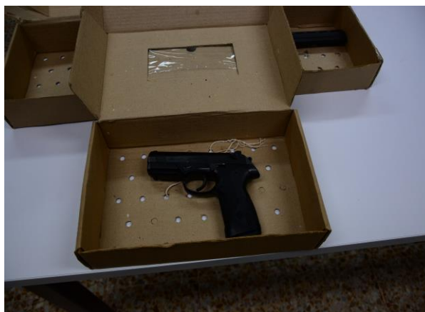
IMAGEN NUMERO 22

IMAGEN NUMERO 23. EVIDENCIA NUMERO 7 SE OBSERVA EMBALADA Y ROTULADA.