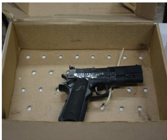
IMAGEN NUMERO 21

IMAGEN NUMERO 21. EVIDENCIA NUMERO 8 SE OBSERVA EMBALADA Y ROTULADA.