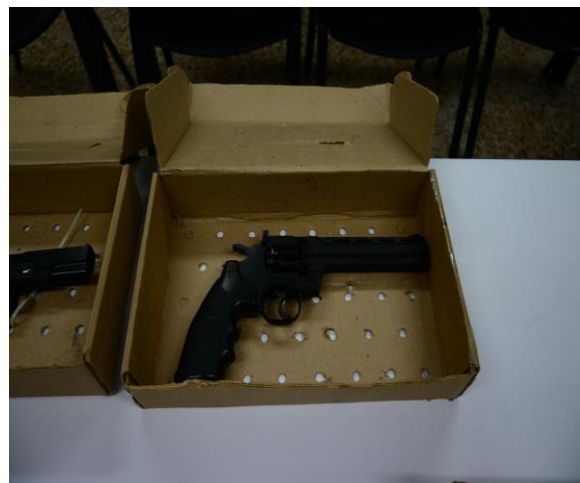
IMAGEN NUMERO 20

IMAGEN NUMERO 20. EVIDENCIA 5 SE OBSERVA EMBALADA Y ROTULADA.