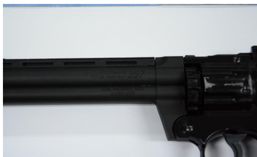
IMAGEN NO.10: PRIMER PLANO: SE OBSERVA EL EMP 5 EL CUAL SE CORRESPONDE A UN ARMA DE FUEGO TIPO PISTOLA, CALIBRE 9 MM , COLOR NEGRO MARCA CROSMAN.

IMAGEN No 09: PRIMER PLANO: SE OBSERVA EL EMP 3 EL CUAL SE CORRESPONDE A UNA MALETA COLOR AZUL.