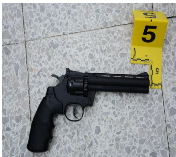
IMAGEN NUMERO 09