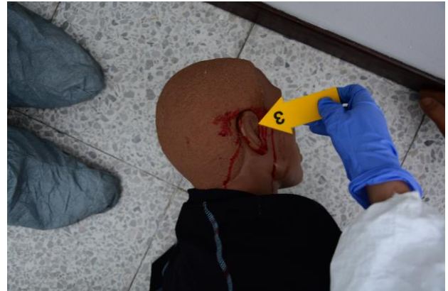
IMAGEN NUMERO 05