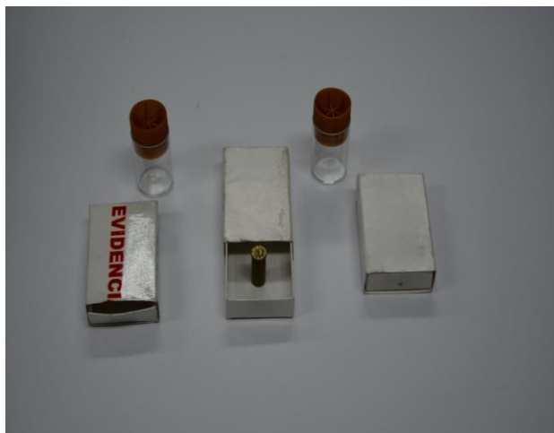
IMAGEN NUMERO 19

IMAGEN NUMERO 19. EVIDENCIA 1 , 3 y 6 SE OBSERVA EMBALADO Y ROTULADO