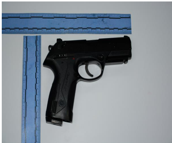
IMAGEN NUMERO 13