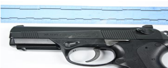
IMAGEN NO.14: PRIMER PLANO: EMP 7 SE OBSERVA UN ARMA DE FUEGO MARCA PELLET, LA CUAL PERTENECE AL PATRULLERO RAMIRO ROJAS.

IMAGEN NO 13: PRIMER PLANO: SE OBSERVA EMP 6 VAINILLA METALICA LA CUAL SE RECOLECTA Y SE EMBALA.