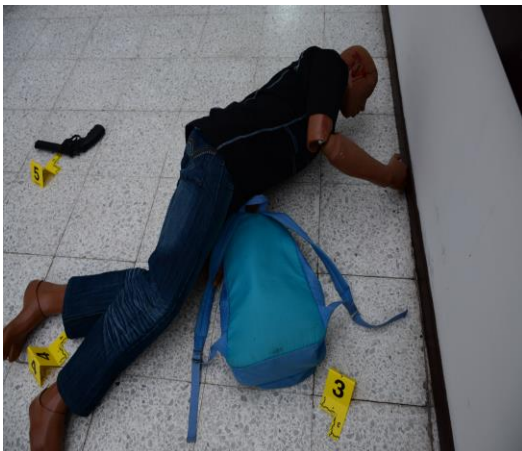
IMAGEN No 02: PRIMER PLANO: SE OBSERVA LA DIRECCION DEL LUGAR DE LOS HECHOS.