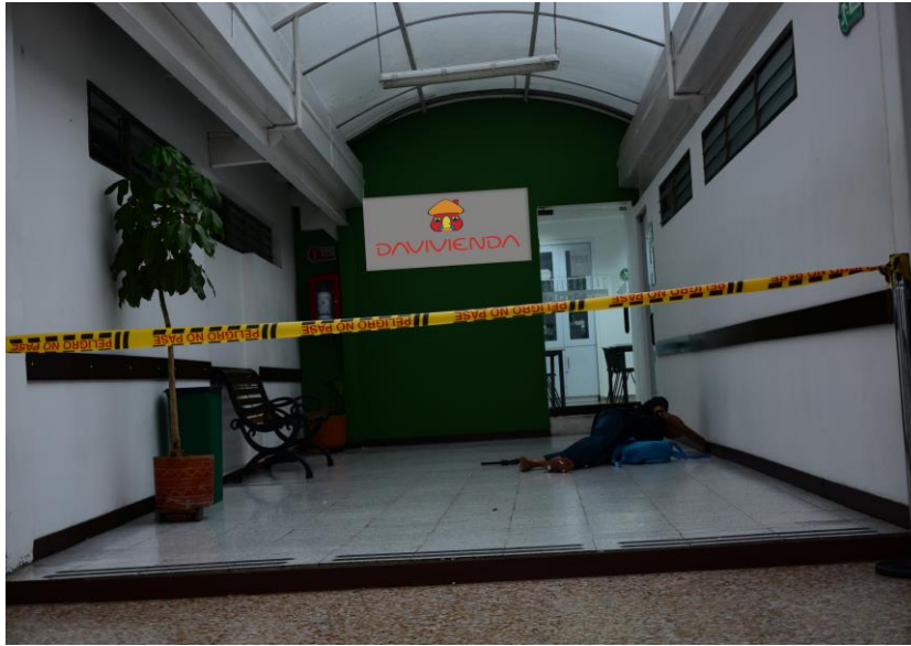
IMAGEN NUMERO 01

IMAGEN No.01. : PANORAMICA: CARACTERISTICAS DEL LUGAR, EL CUAL CORRESPONDE A LA CARRERA 75 # 23G – 40 BARRIO MODELIA, ZONA BANCARIA , SE OBSERVA ACORDONADO Y PROTEGIDO CON CINTA PLASTICA.