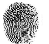
Índice derecho interrogado