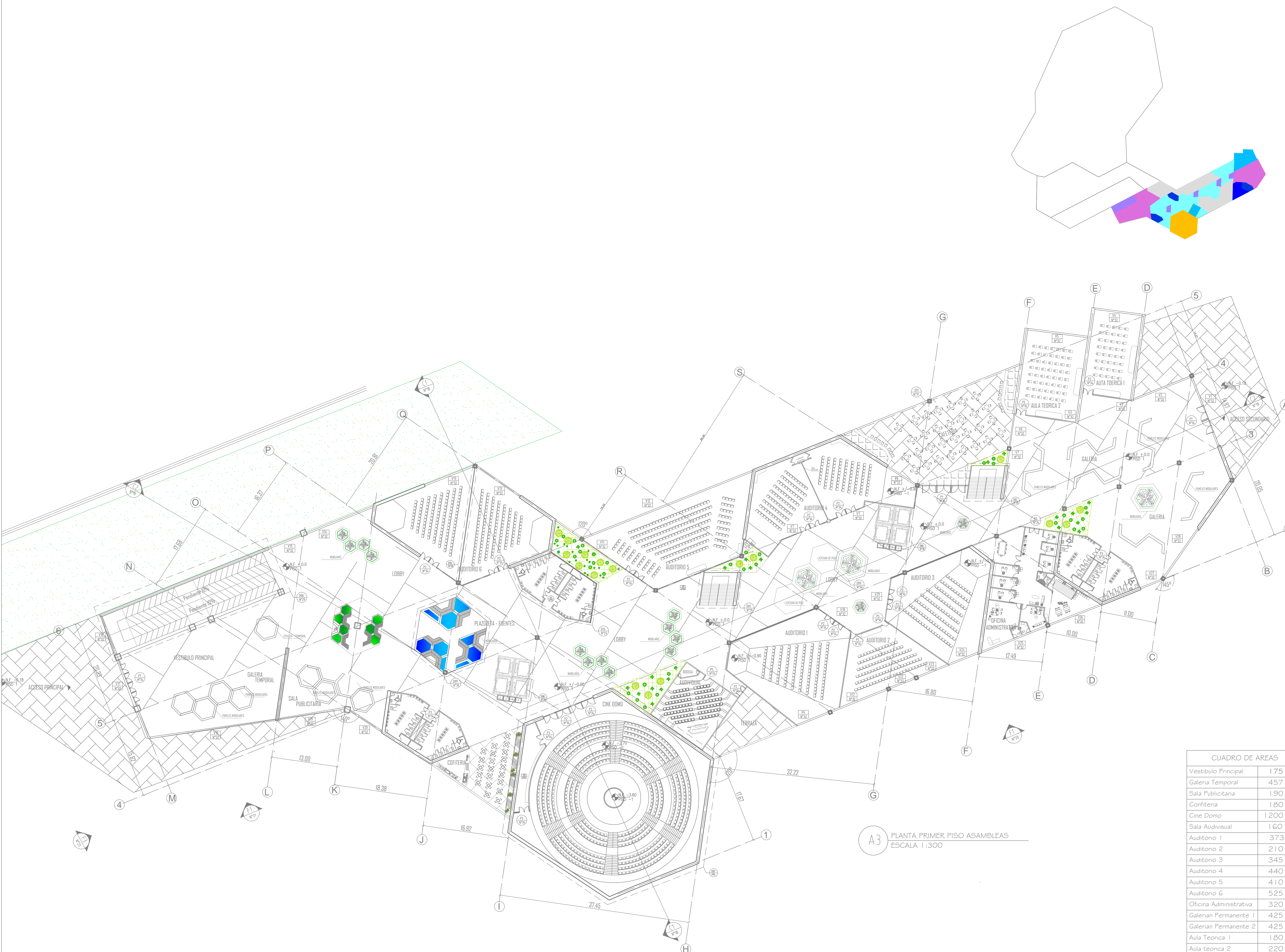
A3 PLANTA PRIMER PISO ASAMBLEAS ESCALA 1:300