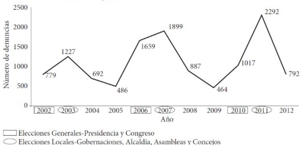
Gráfica 1. Número de denuncias por delitos electorales 2002 - 2012

Fuente: Mapas de factores de riesgo electoral, elecciones nacionales 2014.