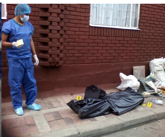
FOTOGRAFIA 4 Recolección de evidencia