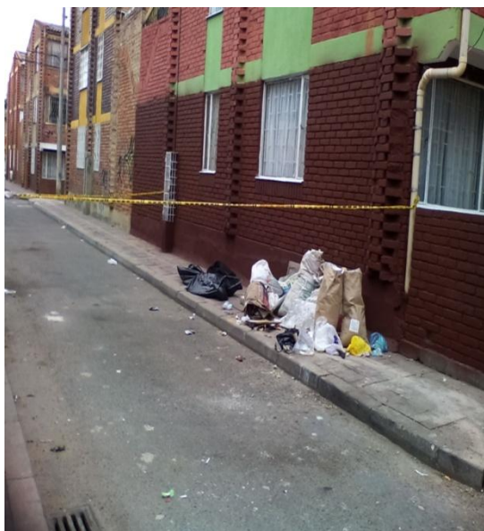
FOTOGRAFIA N 1 primer plano numeración

Wundt, W. (23 de 2 de 2011). Psicología forense . Recuperado el 8 de 11 de 2014, de Psicología forense: https://psicologiajuridicaforense.wordpress.com/2011/02/23/historia-de-la-psicologia-forense/