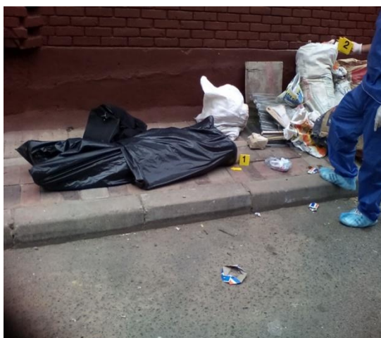
FOTOGRAFIA 3 numeración