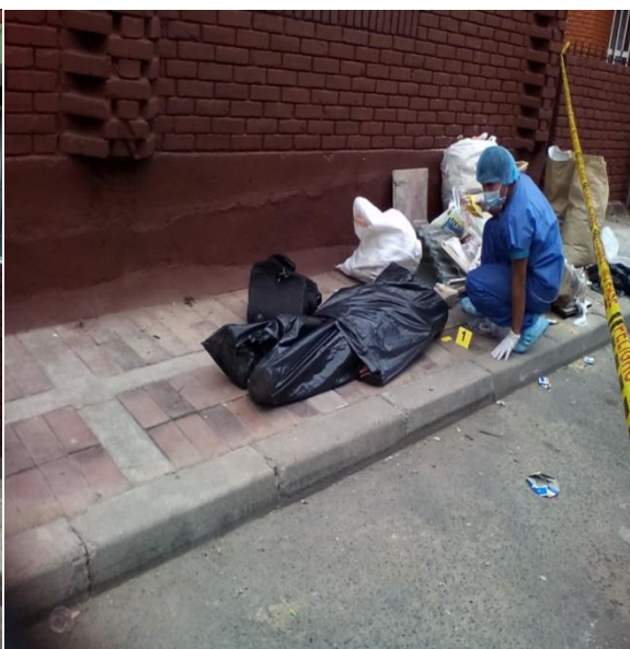
FOTOGRAFIA N 2 segundo plano, numeración