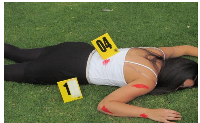
IMAGEN No 05. PLANO GENERAL: Se observa el cuerpo en vía pública en forma lateral con los numeradores