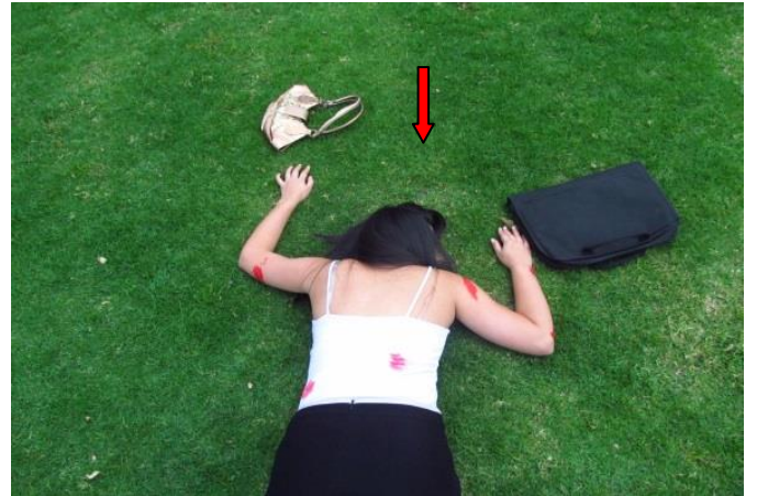
IMAGEN No 03. PLANO GENERAL: Se observa el cuerpo en vía publica en forma lateral