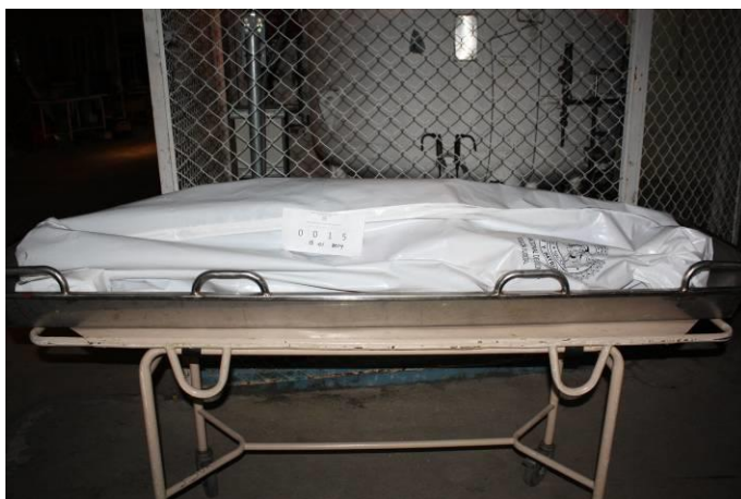
IMAGEN No 11. PLANO GENERAL: se observa cuerpo embalado en bolsa plástica color blanco

Durante la diligencia, quedan archivados en la bodega de imágenes del Gabinete de Fotografía del Grupo de Criminalística de la SIJIN