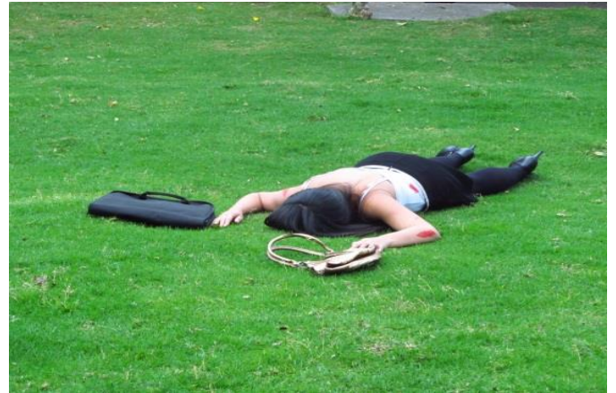
IMAGEN No 01. PANORAMICA: se observa lugar de los hechos ubicado en la Calle 138 No 115 - 22