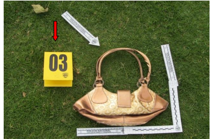
IMAGEN No 08. PRIMER PLANO: se observa cartera color dorado como EMP N°3. SE SEÑALA CON FLECHA COLOR ROJO