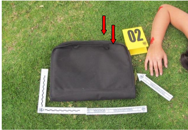
IMAGEN No 07. PLANO MEDIO: se observa portafolio color negro como EMP N°2. SE SEÑALA CON FLECHA COLOR ROJO