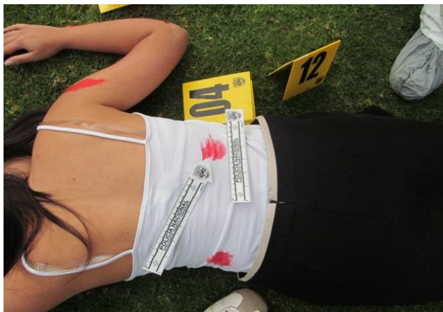
IMAGEN No 09. PRIMERÍSIMO PLANO: Se observa mancha de sangre como EMP N°4. SE SEÑALA CON FLECHA COLOR ROJO