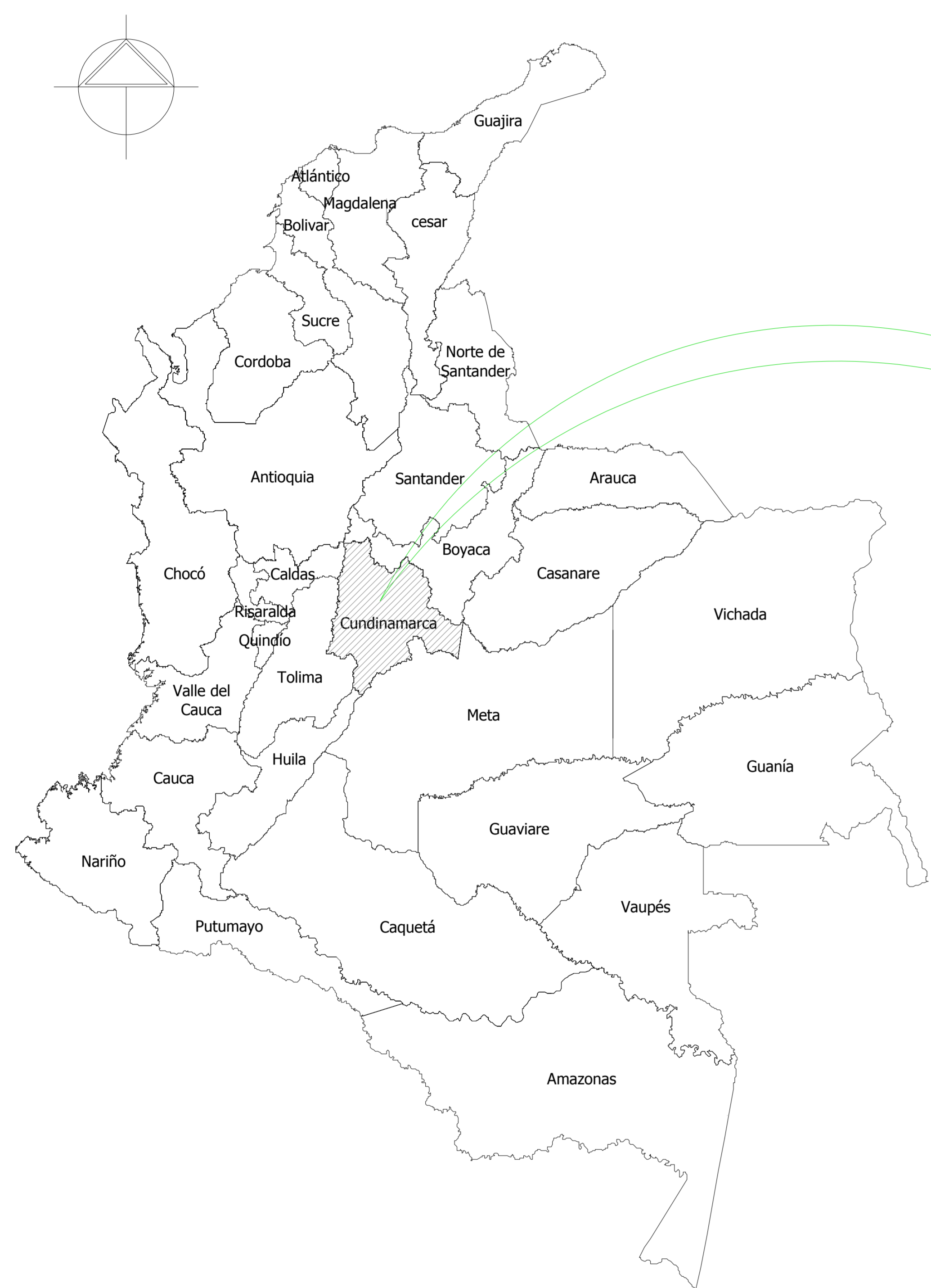
MAPA DE LA REPÚBLICA DE COLOMBIA