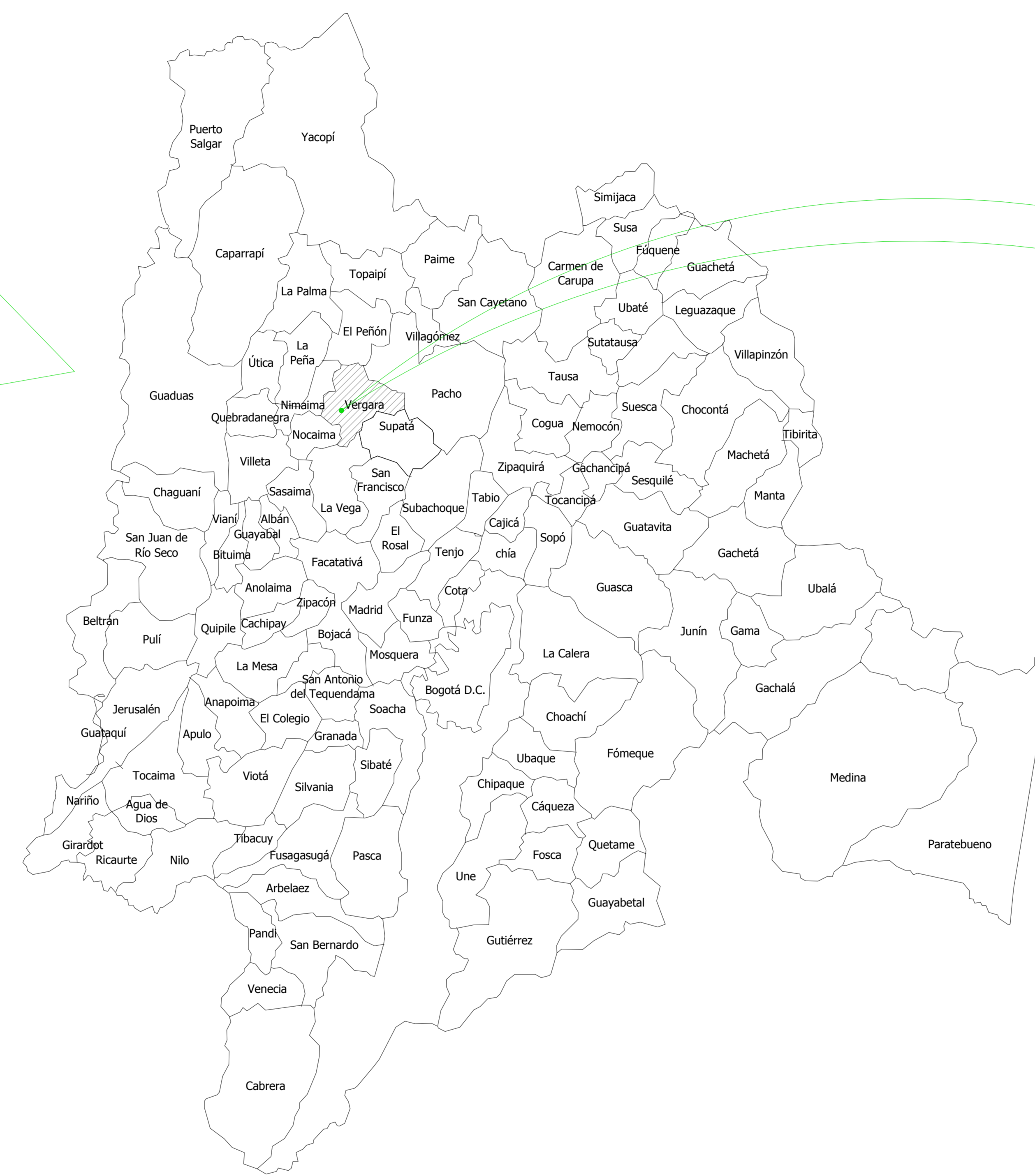
MAPA DEL DEPARTAMENTO DE CUNDINAMARCA