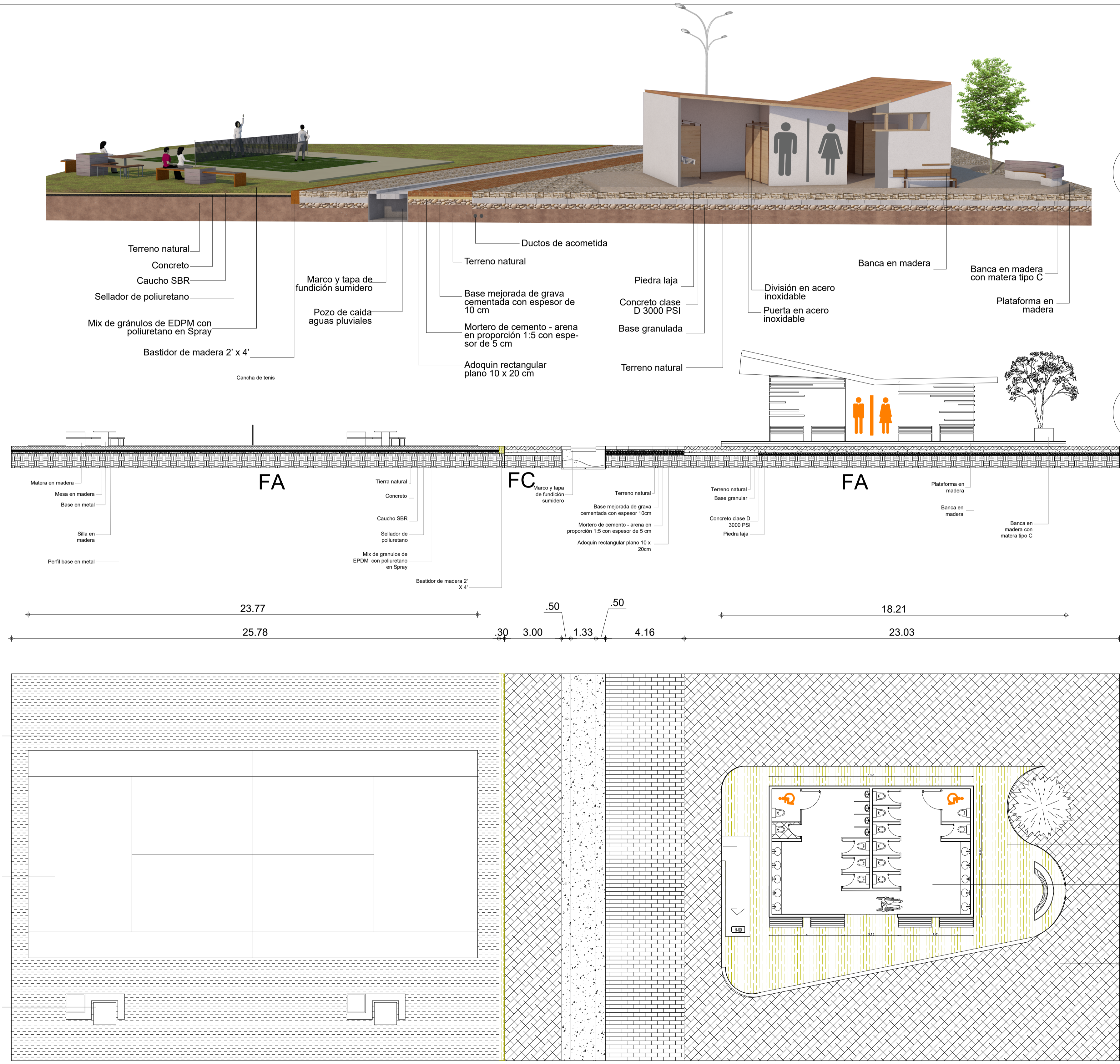
A2 Planta Esc. 1:25